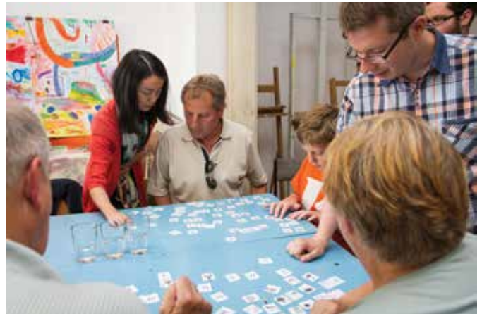
Warsztaty kaligrafii chińskiej w toku