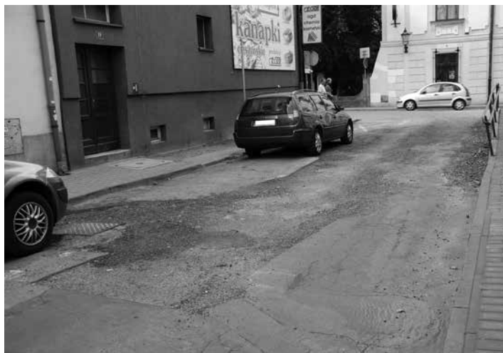
Remont obejmie odcinek ulicy Szersznika od skrzyżowania z ulicą Szeroką do Rynku oraz ulicę Szeroką.

25 lipca została podpisana umowa na remont nawierzchni ulic Szersznika i Szerokiej w Cieszynie.