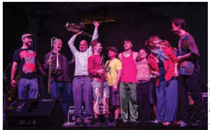
Występ Warsaw Afrobeat Orchestra

Za nami już 5 edycji Festiwalu Europejskich Szkół Artystycznych i Twórczości Kręgi Sztuki i 9 edycji Przeglądu Filmowego Wakacyjne Kadry w Kręgach Sztuki.