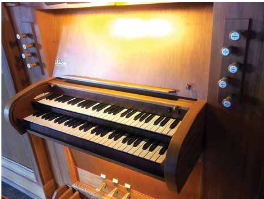
Zakupione przez PSM organy należały do kaplicy ewangelickiej w niemieckim Leverkusen.

Aktualnie, zanim swoją obecnością i dźwiękiem uświetni salę organową, nasz nowy nabytek musi przejść czyszczenie, wymianę niektórych podzespołów (np. skór uszczelniających na miechach i wiatrownicach) i inne drobne zabiegi restauracyjne. W szkolnej sali organy po raz pierwszy powinny zabrzmieć na przełomie września i października tego roku. W planach mamy także zorganizowanie koncertów, przez które chcemy zaprezentować szerszej publiczności wspaniałe możliwości tego instrumentu. Na koncerty już teraz serdecznie zapraszamy!