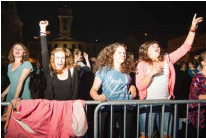
Dobra zabawa na cieszyńskim Rynku