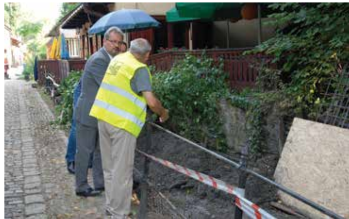
Remont prowadzony jest wszędzie tam, gdzie są to tereny miejskie i prace może wykonać gmina.

Dopełnieniem prac, prowadzonych już w latach ubiegłych nad brzegiem Olzy, będzie budowa dalszej części ścieżki pieszo-rowerowej, biegnącej od ul. 3 Maja pod mostem Wolności wzdłuż rzeki, łączącej się przez Młynską Bramę z ul. Przykopa. Na odcinku zaczynającym się na wysokości restauracji „Dworek Cieszyński” aż do ul. Młynska Brama nieestetyczna część obecnych, stalowych barierek zostanie zastąpiona nowymi, usytuowanymi na murku z węgłkami na ławki i elementy zieleni. Po zakończeniu tych prac rowerzyści będą mogli korzystać z zasadniczo wydłużonej trasy rowerowej, biegnącej wzdłuż brzegów Olzy. Pełną pętlę rowerową planuje się zrealizować w najbliższych latach, po zagospodarowaniu terenów po obu stronach Olzy – od mostu Przyjaźni do mostu kolejowego.