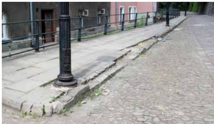
Takie widoki na ul. Przykopa wkrótce odejdą w przeszłość...

Dobra wiadomość dla rodziców i dzieci – na Cieszyńskiej Wenecji pojawi się także plac zabaw, urządzenia do ćwiczeń na świeżym powietrzu oraz niewielka ścianka wspinaczkowa.