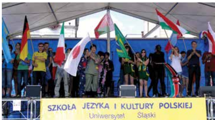
Na kilka dni Cieszyn ponownie stanie się domem dla miłośników języka polskiego ze wszystkich stron świata.