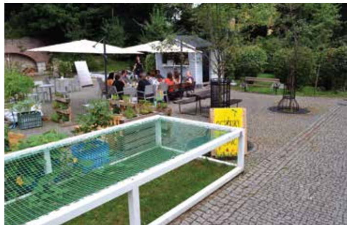
Piknik odbędzie się w zielonej scenerii Wzgórza Zamkowego, letniej kawiarence Spółdzielni Socjalnej OFKA i ogródkach „Bez granic”.

Podróż w czasie? Dlaczego nie! Automobilklub Cieszyński zaprasza na pokaz i przejażdżki zabytkowymi pojazdami.