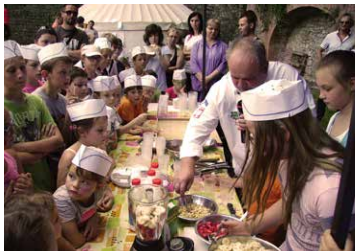
Było smacznie i zabawnie, czyli „Wybuchowa Kuchnia” w skrócie.