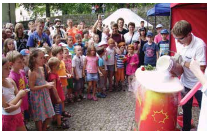
Fizyka nie taka straszna, co potwierdził tłum obserwujących eksperymenty.