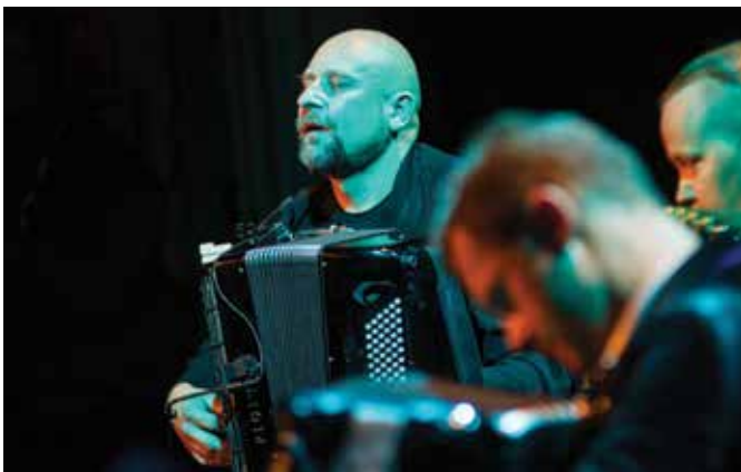
Motion Trio na scenie