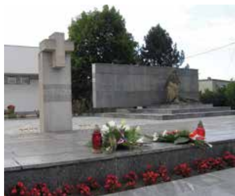
udostępnił Władysław Kristen