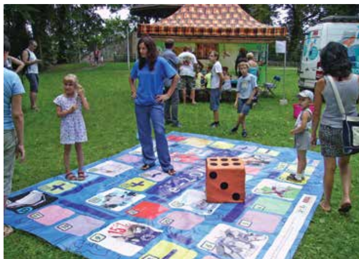
Przyjemne z pożytecznym – gra sprawdzająca wiedzę o zbiórce odpadów.