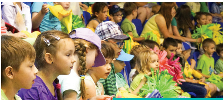
Młoda widownia dopingowała uczestników

„Baw się bezpiecznie” – to sportowa impreza z tradycją, w której udział biorą uczniowie cieszyńskich szkół podstawowych, obchodząc w ten sposób swoje święto, czyli Dzień Dziecka.