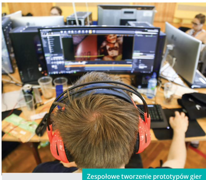
Zespołowe tworzenie prototypów gier