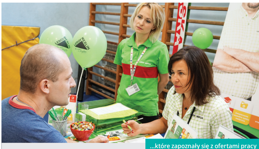
...które zapoznały się z ofertami pracy