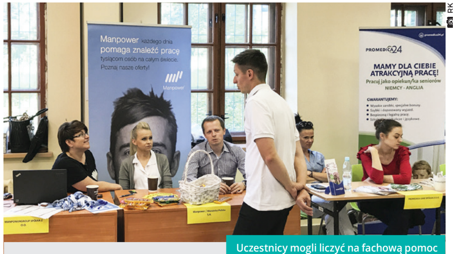
Uczestnicy mogli liczyć na fachową pomoc