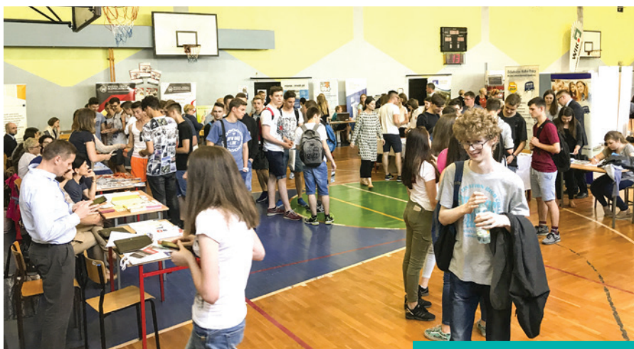
Targi odwiedziło wiele osób...

W ydarzenie było znakomitą okazją do nawiązania bezpośredniego kontaktu z pracodawcami różnych branż oraz zapoznania się z aktualnymi ofertami zatrudnienia przede wszystkim na naszym lokalnym rynku pracy, ale również w państwach Unii Europejskiej. Umożliwiły również uczniom szkół ponadgimnazjalnych, którzy w najbliższym czasie będą dokonywać wyborów związanych z dalszą ścieżką kształcenia, kontakt z przedstawicielami szkół prezentujących swoją ofertę edukacyjną.