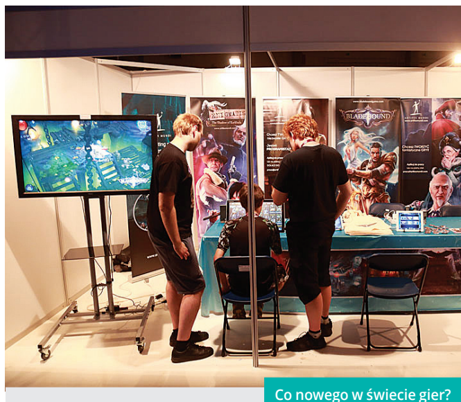
Co nowego w świecie gier?