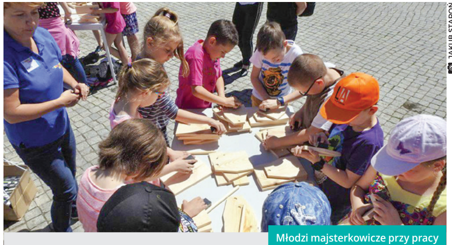
Młodzi majsterkowicze przy pracy

Kolejna majsterkowa impreza – Urodziny Castoramy – została zaplanowana na 30 lipca i odbędzie się na półmetku wakacji. Jak zwykle nie zabraknie atrakcji – oby tylko dopisała pogoda! ♦