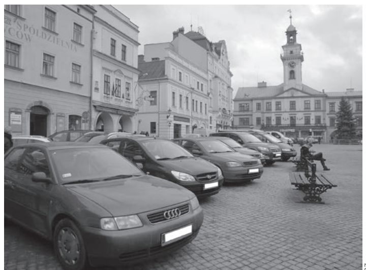
Od 22 grudnia obowiązywać będzie zakaz parkowania samochodów na płycie Rynku za wyjątkiem (tymczasowo) kilkunastu miejsc od strony poczty.

Jednocześnie informujemy, że przebudowa kanalizacji w śródmieściu Cieszyna weszła w fazę prób, badań i odbiorów technicznych, dlatego też na ulicach można spotkać specjalistyczny sprzęt, którym wykonuje się płukanie kanałów oraz przeprowadza się inspekcję kamerami TV nowo wybudowanych oraz zmodernizowanych kanałów. Ich celem jest sprawdzenie poprawności wykonanych robót oraz skuteczności przeprowadzonego rozdziału kanalizacji ogólnospławnej na kanalizację sanitarną i kanalizację deszczową, co ma zapobiegać odprowadzaniu ścieków do cieków wodnych. Dlatego też prosimy mieszkańców oraz przedsiębiorców o niewylewanie ścieków sanitarnych (np. po myciu podłóg czy naczyń, resztek pokarmów itp.) do kanalizacji deszczowej przez kratki ściekowe w ulicach, gdyż wody te są odprowadzane obecnie bez-