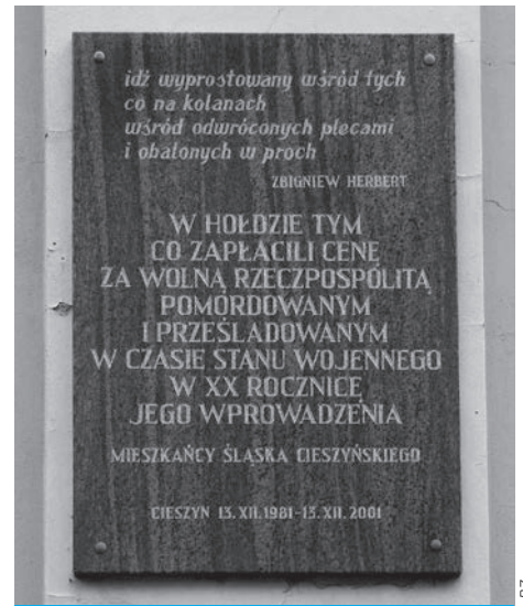
Pamiątkowa tablica znajdująca się na ul. Szerokiej.