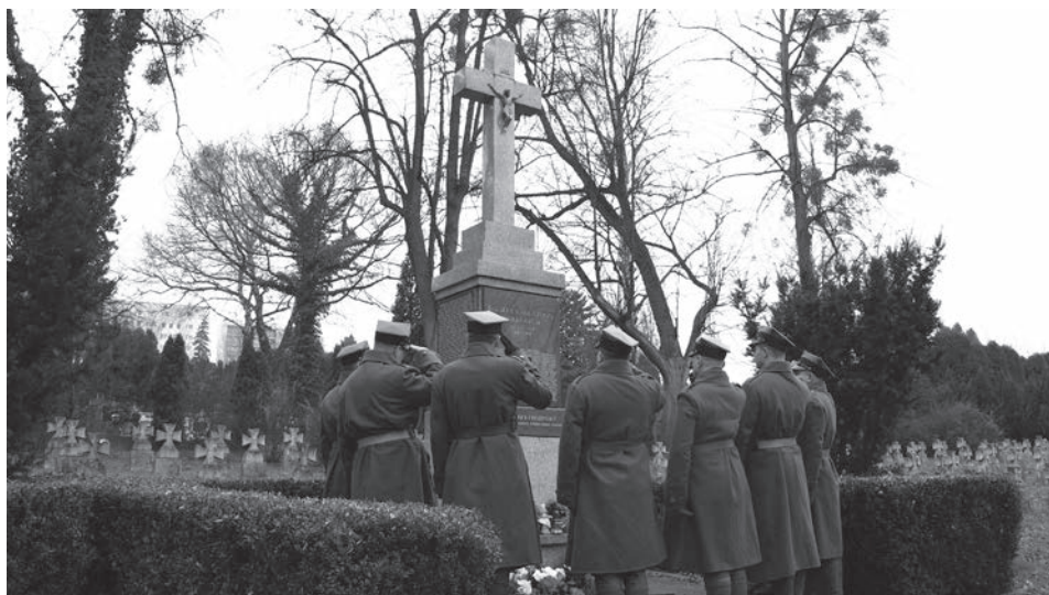
Goście z Łowicza odwiedzili ważne dla 10 Pułku Piechoty miejsca w Cieszynie.