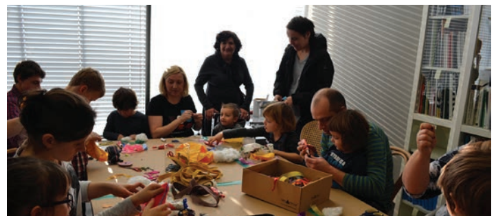
Szycie karp staje się zamkową tradycją świąteczną, którą polubiło wiele osób.

Cieszyn do 15 lutego. Przedświąteczne spotkanie zakończyła rozmowa poświęcona Kalendarzowi Beskidzkiemu 2015. Ci, którym nie udało się dotrzeć do Zamku na „Zaprojektuj Święta” mogą się wybrać, żeby zobaczyć nie tylko wystawę wyjątkowych lamp, ale też konkursowe ciasteczka oraz ekspozycję szopek i obrazów na szkłe z kolekcji Muzeum Śląskiego.