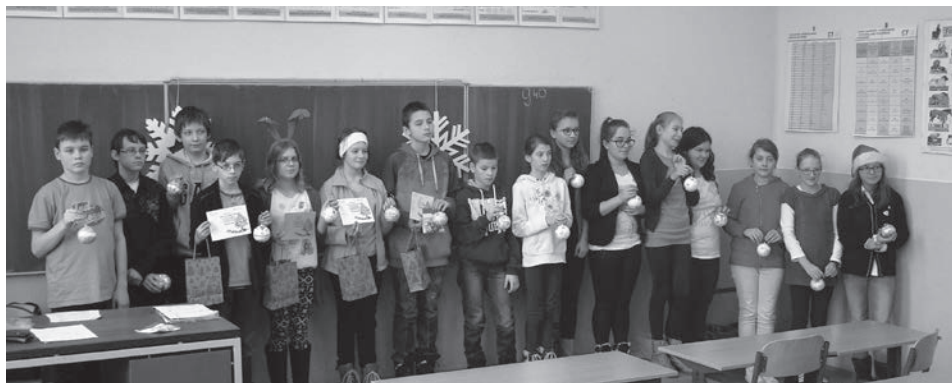
Uczestnicy konkursu z języka angielskiego „Christmas quiz”.