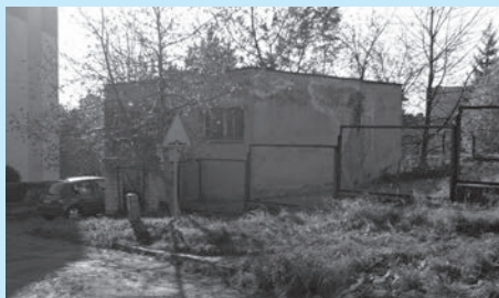
Na sprzedaż przeznaczone są działki zabudowane hydrofornią oraz zbiornikiem wodnym.

Wykaz nieruchomości przeznaczonych do zbycia został wywieszony na tablicy ogłoszeń Urzędu Miejskiego w Cieszynie (Rynek 1, I piętro) na okres od 3 do 23 grudnia 2014 r.