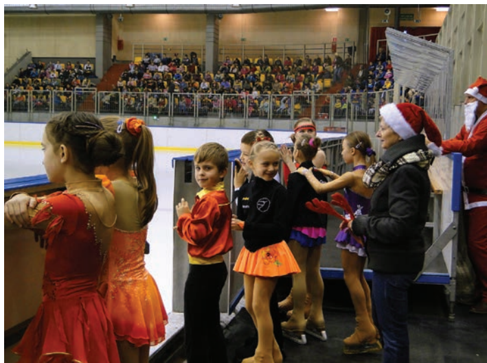
Mikołajki na lodowisku co roku są strzałem w dziesiątkę!