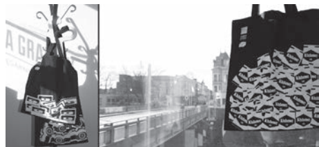
W Świątlicy KP można też otrzymać mapy-torby.

Rozdajemy też unikatowe mapy-torby w czterech wzorach, które w komplecie przedstawiają „mapę” przemytu na granicy polsko-czeskiej.