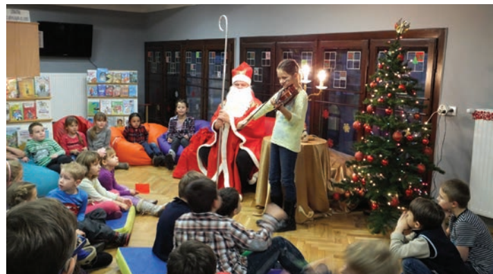
Święty Mikołaj zawiązał do Biblioteki Miejskiej w Cieszynie.