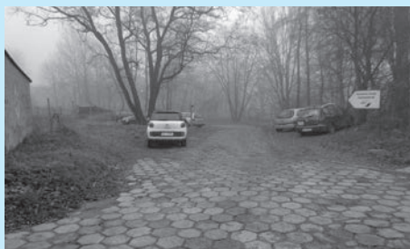
Na sprzedaż: nieruchomość przy ul. Heczki.

Wykaz nieruchomości przeznaczonych do zbycia został wywieszony na tablicy ogłoszeń Urzędu Miejskiego w Cieszynie (Rynek 1, I piętro) na okres od 3 do 23 grudnia 2014 r.