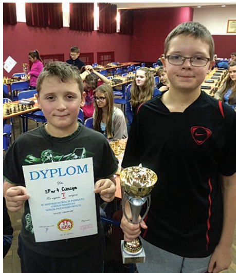
Utalentowani szachiści z SP4.