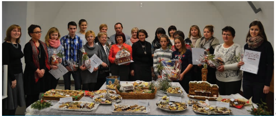
Duża ilość zgłoszonych do konkursu słodkich zestawów utwierdziła jury w przekonaniu, że tradycja pieczenia cieszynskich ciasteczek nie zginie.