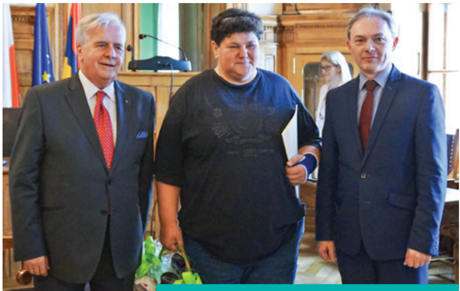
Podziękowanie za zasługi od przedstawicieli władz miasta

••• Obie te czynności pozwalają pozostawać w domu. Nie przekraczać bezpiecznej