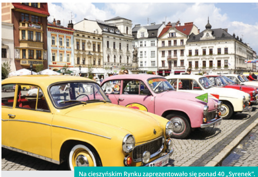
Na cieszyńskim Rynku zaprezentowało się ponad 40 „Syrenek”.