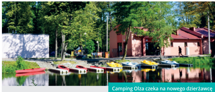
Camping Olza czeka na nowego dzierżawcę

Camping Olza, który kiedyś tętnił życiem znów ma szansę stać się atrakcyjnym turystycznie miejscem w mieście. Przetarg, mający na celu wyłonienie nowego dzierżawcy, zaplanowano na drugą połowę czerwca.