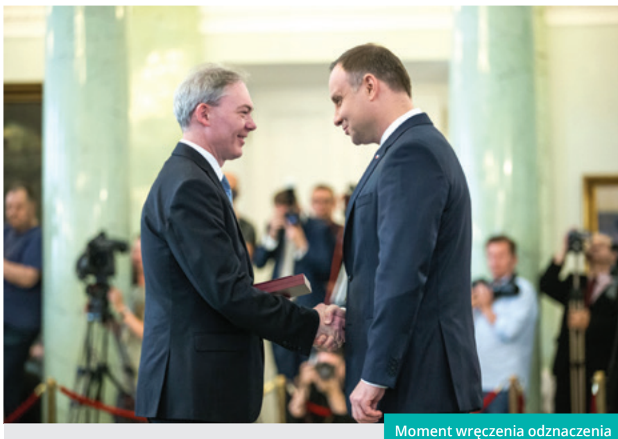
Moment wręczenia odznaczenia

Podczas uroczystości, które odbyły się 29 maja w Warszawie, Prezydent podziękował odznaczonym za służbę i czynne uczestnictwo w budowaniu potencjału Rzeczypospolitej. Odznaczenia państwowe wręczone przedstawicielom samorządu terytorialnego to również wyróżnienie dla miasta i całej społeczności lokalnej.