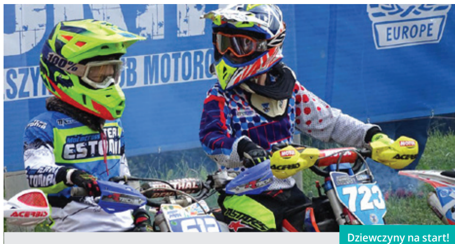
Dziewczyny na start!

Trzydziestoletni tor motocrossowy w Cieszynie-Boguszowicach uchodzi za jeden z najnowocześniejszych tego typu obiektów w Polsce. Mieli szansę się o tym przekonać zawodnicy, podczas rozegranych w miniony weekend (20-21 maja) po raz trzeci Mistrzostw Europy w Motocrossie.