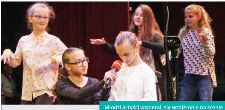
Młodzi artyści wspierali się wzajemnie na scenie

- Celem „Szkolnej Ławki Artystycznej” nie jest pokazanie się na tej scenie, lecz