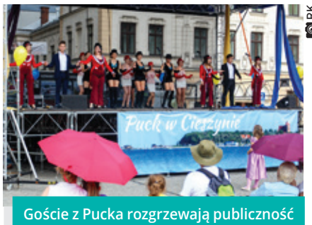
Goście z Pucka rozgrzewają publiczność

Atrakcją będzie występ zespołu ColoRed – mieszanki niesamowitej energii i nietuzinkowych osobowości scenicznych. Ich siłą jest przyjaźń, a mocą napędową muzyka. Każdy z pięciu członków zespołu to odrębny element, inna historia – razem tworzą niebagatelną miksturę kreatywności, pozytywnego przekazu oraz miłości do muzyki. Poznali się podczas projektu