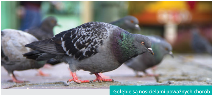
Gołębie są nosicielami poważnych chorób

■ Aspergilozę – chorobę wywołaną przez grzyby z rodziny Aspergillus , atakującą drogi oddechowe i przewód pokarmowy. Choroba ta przyjmuje różne postacie, począwszy od typowych chorób alergicznych, a skończywszy na zakażeniach ogólnych będących zagrożeniem dla życia. Objawami choroby najczęściej są ostry kaszel, ciężki i świszczący oddech oraz poczucie osłabienia i rozbicia.