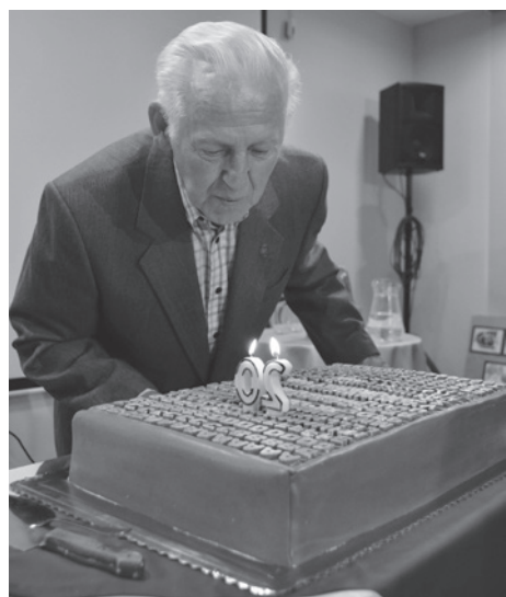
Urodzinowy tort miał wymiar industrialny.

Nie jest może tak wiekowe, jak Muzeum Śląska Cieszyńskiego, ale pomimo młodego wieku także może pochwalić się wieloma sukcesami, jak choćby wpisaniem na Listę Szlaku Zabytków Techniki, oraz licznymi wystawami. Muzeum Drukarstwa w Cieszynie, bo o nim mowa, świętowało 20. urodziny.