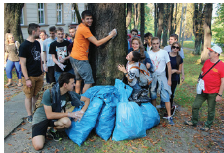
Sprzątanie sprawiło dużą frajdę młodzieży.

16 września, już po raz 17., Komisja Ochrony Przyrody PTTK Beskid Śląski, zorganizowała Jesienne Sprzątanie Rezerwatów Przyrody na terenie Cieszyna. Uczestniczyły w nim cztery cieszyńskie szkoły: LO im. Osuchowskiego, Zespół Szkół Ponadgimnazjalnych im. W. Szybińskiego, Zespół Szkół Ekonomiczno-Gastronomicznych oraz Gimnazjum nr 2. Uczniowie pod nadzorem swych opiekunów szkolnych oraz przedstawicieli komisji wysprzątali m.in. laski miejskie nad Olzą i Puńcówką, rezerwat Kopce , a także osiedla Liburnia i ZOR oraz Błogocice. Łącznie zebrano około 60 worków o pojemności 100 litrów, pełnych szkła i plastiku. Na koniec przeprowadzono konkurs