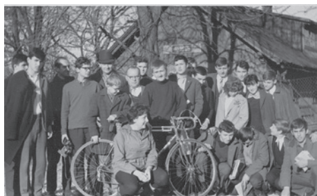
Założenie klubu - Ustroń 1966.