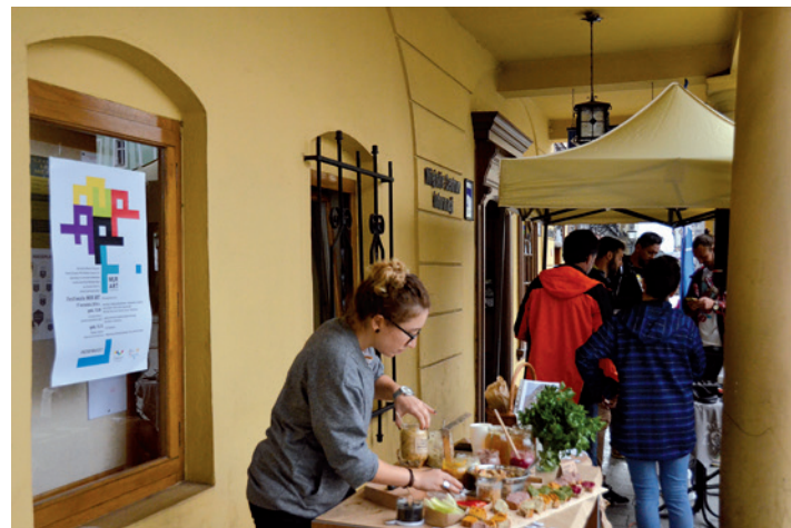
Zdrowo i kolorowo, czyli smaki kuchni ekologicznej.