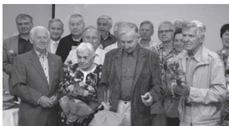
Jubileuszowe pamiątkowe zdjęcie.