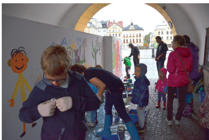
Radosna zabawa dla małych i dużych.