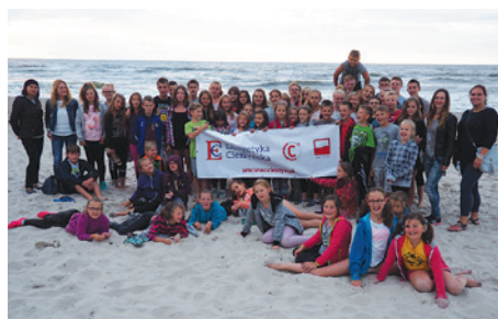
Nad Bałtykiem koloniści czuli się doskonale.

W dniach od 3 do 17 sierpnia Oddział Powiatowy TPD zorganizował, jak co roku, cieszące się dużą popularnością kolonie letnie nad morzem. W tym roku ponownie zostały