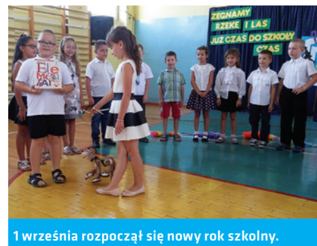
1 września rozpoczął się nowy rok szkolny.