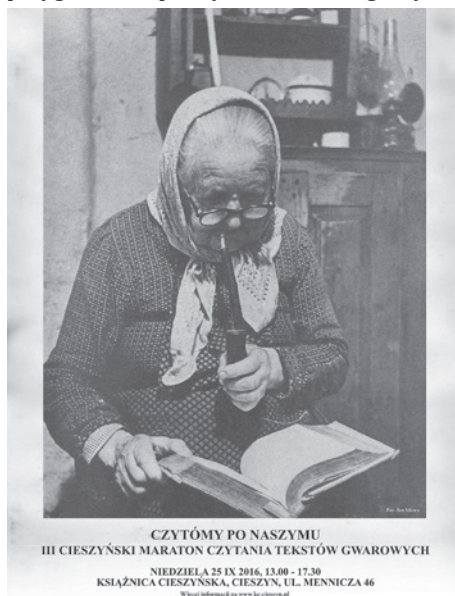
CZYTAMY PO NASZYMU III CIESZYŃSKI MARATON CZYTANIA TEKSTÓW GWAROWYCH NIEDZIELA 25 IX 2016, 13.00 - 17.30 KSIĄŻNICA CIESZYŃSKA, CIESZYŃ, UL. MENNICZA 46 Wszystkiemu dziękujemy