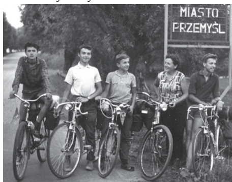
Na rogatkach Przemysła, rok 1966.