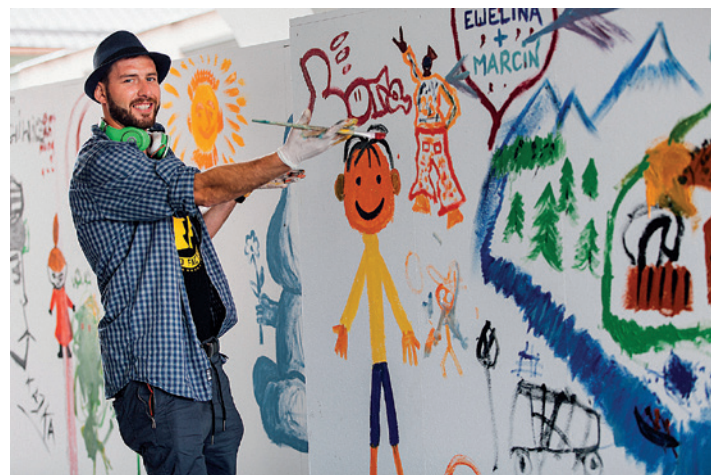
Wesoła twórczość uczestników festiwalu.