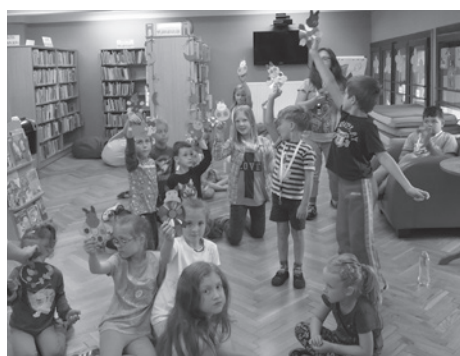
W Bibliotece Miejskiej zawsze jest ciekawie.

Lipiec i sierpień w dziale dziecięcym Biblioteki Miejskiej w Cieszynie to czas wyjątkowych spotkań i akcji, w których uczestniczą mali cieszyńscy oraz przybyli do naszego miasta wakacyjni goście z całej Polski. Także tego roku dzieciaki chętnie i licznie odwiedzały naszą placówkę, by miło spędzić czas wśród książek, czytając, bawiąc się, a także korzystając z multimedialnych oraz uczestnicząc w wybranych propozy-