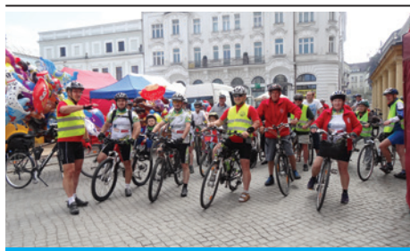
Czas na kolejną wycieczkę rowerową.