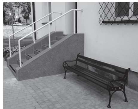
Warto wyjść z inicjatywą lokalną.