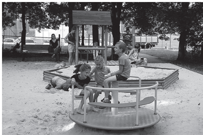
Zabawa na nowym placu zabaw sprawia radość wszystkim dzieciom.