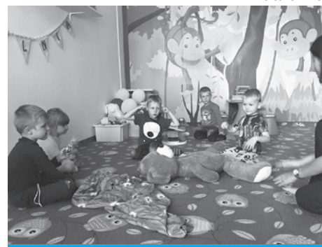
Dzieci zgłębiały tajniki angielskiego.