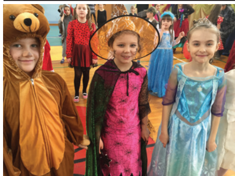
Wszyscy bawili się świetnie.