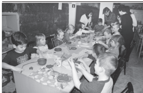
Dzieci lubią brać udział w warsztatach.

Wolontariat pracowniczy nie tylko wpływa na zaangażowanie pracownicze, ale również przyczynia się do rozwiązywania lokalnych problemów, odpowiadając na potrzeby mieszkańców. Realizowany od 2014 roku w Grupie Raben zmienił lokalną rzeczywistość aż w 44 miejscowościach, przyczyniając się do rozwijania relacji firma – lokalne otoczenie.