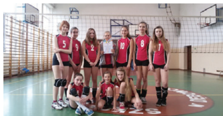
Zwycięska drużyna siatkarek.

Do rozgrywek przystąpiło sześć szkół podstawowych. Trzecie miejsce zajęła SPTE, na drugim uplasowała się SP6, a na najwyższym stopniu podium stanęły dziewczynki z SP3. Do kolejnego etapu rozgrywek na szczeblu grup powiatowych awansowały dwie szkoły: SP3 i SP6. 8 lutego na siatkarskim boisku w Dębowcu spotkały się reprezentacje szkół podstawowych z gmin: Dębowiec, Pogwizdów i Cieszyn. Rozegrano cztery mecze.