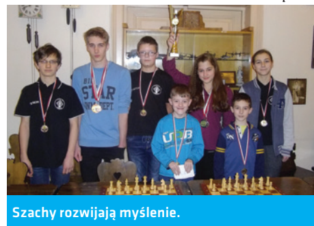
Szachy rozwijają myślenie.