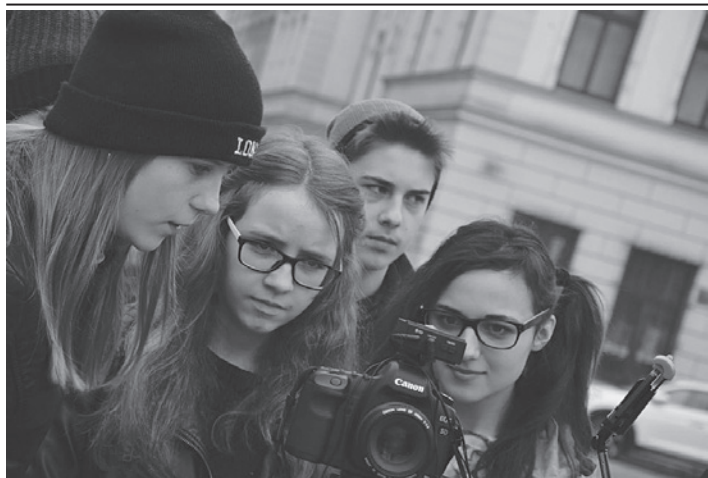
Zainteresowanie warsztatami było duże.