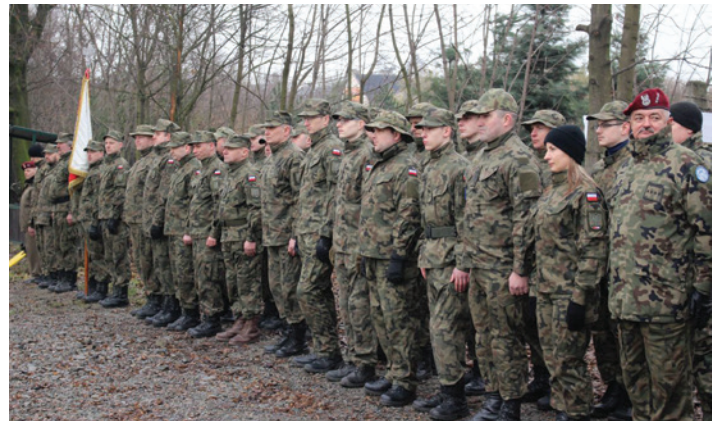
Cieszyńska Kompania Obrony Narodowej w pełnej gotowości.

Tymczasem uroczystości z okazji 75. rocznicy pierwszego zrzutu cichociemnych w Dębowcu zgromadziły tłumy widzów.