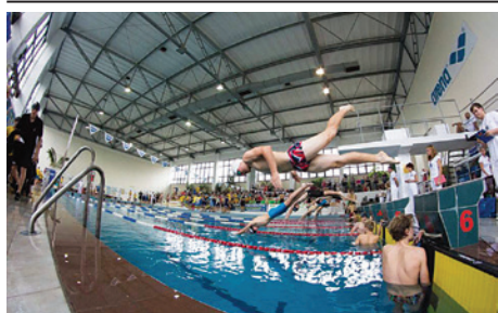
Cieszyńskie zawody pływackie zostały docenione.

Miło nam poinformować, że Międzynarodowe Zawody Pływackie o Puchar MTP Delfin Cieszyn wygrały plebiscyt portalu Megatiming.pl na najlepszą imprezę roku