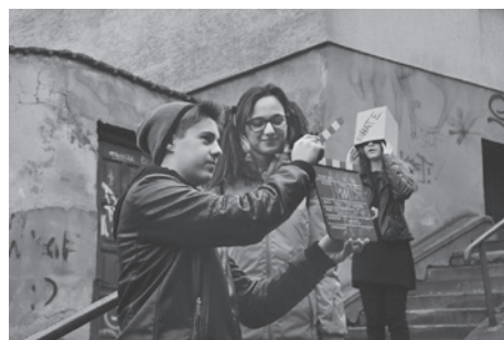
Kolejny kłaps na planie zdjęciowym.