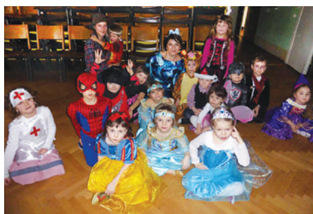
Karnawał to czas zabawy w każdym przedszkolu.

Karnawał to miła tradycja wypełniona muzyką i zabawą, którego ważnym elementem są bale karnawałowe. Bal karnawałowy dla przedszkolaków to dzień, na który niecierpliwie czekają przez wiele dni. Zabawa na takim balu dostarcza dzieciom wielu przeżyć i radości. W ostatni piątek stycznia w Przedszkolu Towarzystwa Ewangelickiego odbyła się taka właśnie zabawa. Na początku dzieci zaprezentowały swoje piękne stroje oraz pozowały do pamiątkowych zdjęć. W sali przystrojonej balonami i girlandami dzieci mogły poczuć się jak na wielkim balu. Wspólnie bawiły się przy muzyce, brały udział w mini konkursach, a podczas krótkich przerw częstowały się różnymi smakołykami. Kiedy czas zabawy dobiegł końca przedszkolaki z żalem opuszczały salę balową. Zabawa na balu przyniosła za-