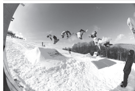
Śnieżne akrobacje na desce.

W sobotę 20 lutego w snowparku na stoku Poniwiec w Ustroniu kluby snowboardowe Freestyle Sports Union Cieszyn oraz Szkoły snowboardu Pauliny Ligockiej zorganizowali Snowboardowe Mistrzostwa Cieszyna slope style i big air Raven Contest .