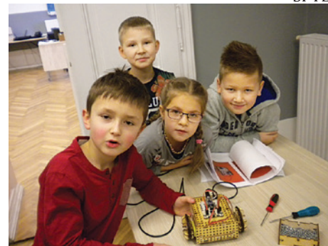
Uczniowie zadowoleni z zajęć.