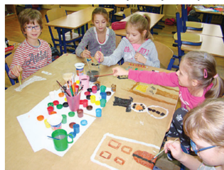
Zabawa była przednia.