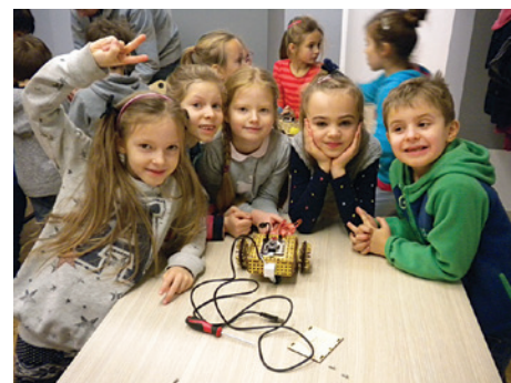
Roboty to być może nasza przyszłość.

Nasi najmłodsi uczniowie skutecznie ubarwiają szkolne korytarze. Wszędzie ich pełno, zewsząd dobiegają ich wesołe głosy. Warto czasem przyjrzeć się im bliżej – ci młodzi ludzie to nasi przyszli lekarze, rzemieślnicy, odkrywcy, konstruktorzy... Jak obudzić w nich pasję? Jak rozbudzić chęć tworzenia? W Szkole Podstawowej Towarzystwa Ewangelickiego wiemy, że właśnie w tym najmłodszym szkolnym okresie, głowy dzieci są szczególnie chłonne, emocje rozbuchane, rzeczywistość zdaje się nie mieć granic. To czas, kiedy trzeba pokazać naszym młodym wychowankom świat we wszystkich barwach i odcieniach.