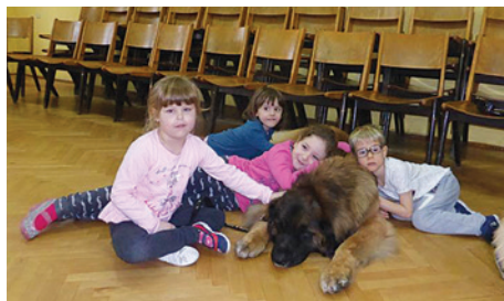
Do takiego psa aż miło się przytulić.

Podczas zajęć prowadzonych w przedszkolu dzieci mogą stopniowo zapoznawać się z psem, jego zwyczajami, jedzeniem czy nawykami. Początkowo, osuwając się z czworonogiem, mogą go dokładnie obejrzyć – jakie ma łapy, uszy, oczy i ogon. Dotykają jego sierści i potrafią określić, czy jest ona szorstka czy miękka, długa czy krótka oraz określić jej barwę: jasna czy ciemna. Te pierwsze ćwiczenia z psem budują zaufanie między nim a dzieckiem. Nabiera ono poczucia bezpieczeństwa, osuwają się z nową sytuacją, a także jest instruowane, w jaki sposób bezpiecznie postępować z czworonogiem. Uczy się także, aby przy zwierzęciu zawsze zachować ostrożność. Te pierwsze kroki dziecka z psem są niezmiernie ważne w prowadzeniu dalszych zajęć. Najmłodszych bowiem należy