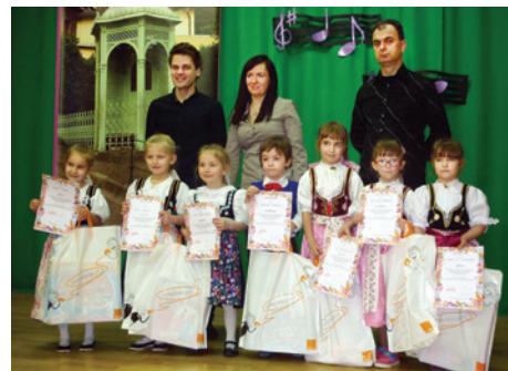
Młodzi cieszyńscy potrafią śpiewać.