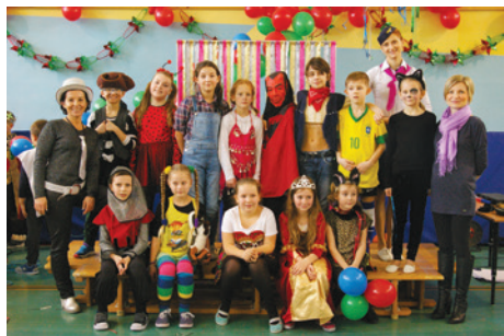
Przebrania były bardzo różne.