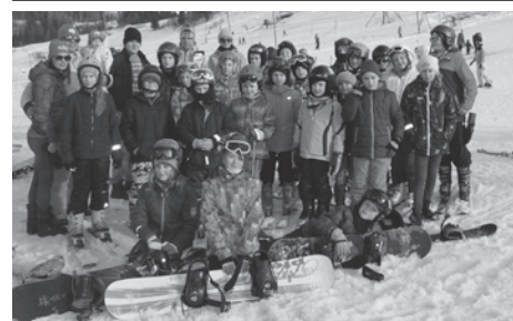
Karatecy radzą sobie też dobrze na śniegu.

Jak zwykle zawodnicy K.S. Shindo nie próżnowali podczas ferii i wykorzystali ten czas na sport połączony z relaksem, treningiem karate, dobrą zabawą i wypoczynkiem.