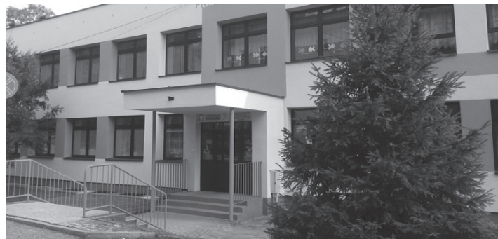
Przedszkole nr 20 przy ul. Św. Jerzego 4.

powołana przez dyrektora przedszkola. Komisja rekrutacyjna przeprowadzi weryfikację wniosków pod względem formalnym, tj. czy wniosek wypełniono prawidłowo i czy do wniosku dołączono wszystkie wymagane załączniki. Weryfikacji podlegać będą również oświadczenia i dokumenty potwierdzające spełnienie poszczególnych kryteriów. Listy dzieci przyjętych do danego przedszkola zostaną opublikowane 5 maja na powyższej stronie internetowej i w poszczególnych przedszkolach.