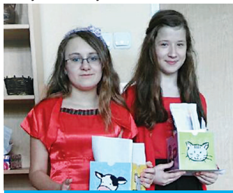
Waleńtkowi listonosze mieli pełne ręce roboty.

Wystarczyło w ciągu tygodnia wrzucić do waleńtkowej skrzynki ozdobną kartkę z danymi adresata, czyli imię oraz klasę, a już w piątek kartka została wręczona ukochanej osobie. Walentynowa skrzynka bardzo szybko wypełniła się listami, lizakami, serduszkami oraz własnoręcznie wykonanymi kartkami. Listonosze, choć mieli pełne ręce roboty, sprawiali radość w każdej klasie, w której tylko się pojawili. Przekazywali miłe wiadomości nie tylko uczniom, ale i nauczycielom. To był najmiłszy dzień w całym roku!