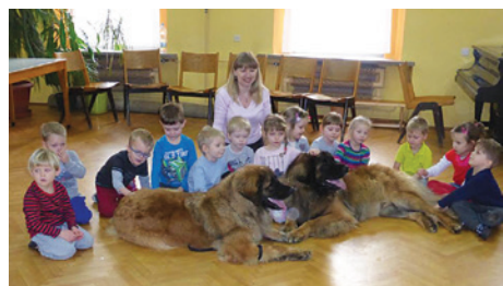
Miłe spotkanie z leonbergerami.