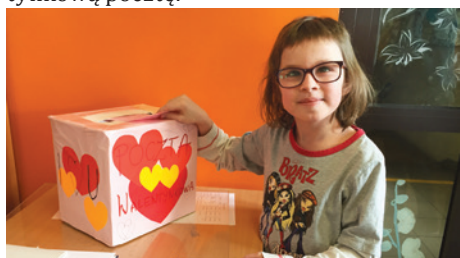
Kto by nie chciał otrzymać „waleńtki”?

12 lutego, czyli w ostatni piątek przed feriami, uczniowie Samorządu Uczniowskiego z SP3 tradycyjnie zorganizowali waleńtkową pocztę.