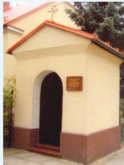
Kapliczka przy ul. Puńcowskiej 48

Święta Katarzyna (Imię zakonne Maria Magdalena de Pazzi, dziewica)