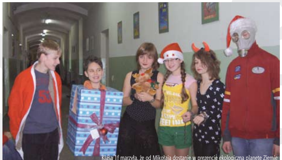
Klasa 1f marzyła, że od Mikołaja dostanie w prezencie ekologiczną planetę Ziemię