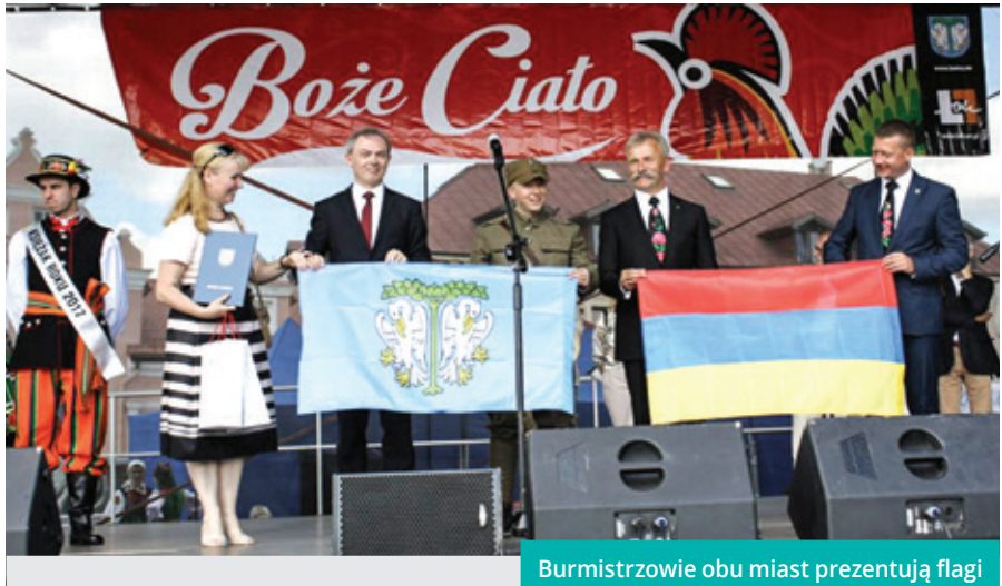
Burmistrzowie obu miast prezentują flagi