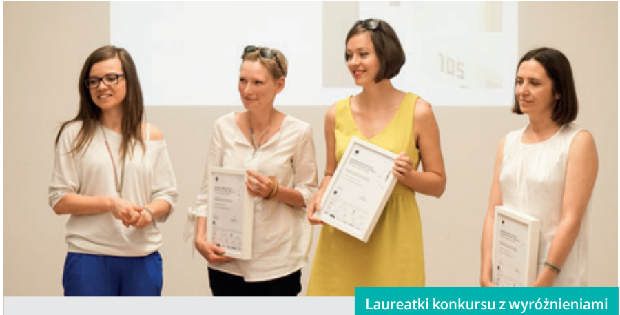
Laureatki konkursu z wyróżnieniami

- Zamek Cieszyn jednoczy ziemie historycznie należące do Śląska właśnie w tych działaniach twórczych, kreatywnych i kulturalnych. Cieszymy się, że „Śląska Rzecz” zawędrowała także do województwa opolskiego i będziemy