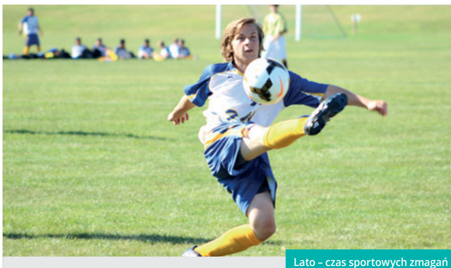
Lato – czas sportowych zmagani

Jak co roku Wydział Sportu wraz z klubami sportowymi, instytucjami miejskimi i organizacjami pozarządowymi przygotowuje Sportową Akcję „Lato w Mieście”. W jej ramach zostały zaplanowane turnieje i zawody, również międzypokoleniowe. Oferta jest niezwykle bogata – od rozgrywek piłki nożnej poprzez zajęcia z samoobrony po grę w boule. Z pewnością każdy znajdzie tutaj coś dla siebie.