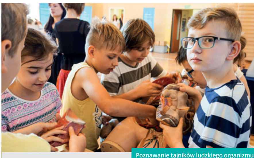
Poznawanie tajników ludzkiego organizmu