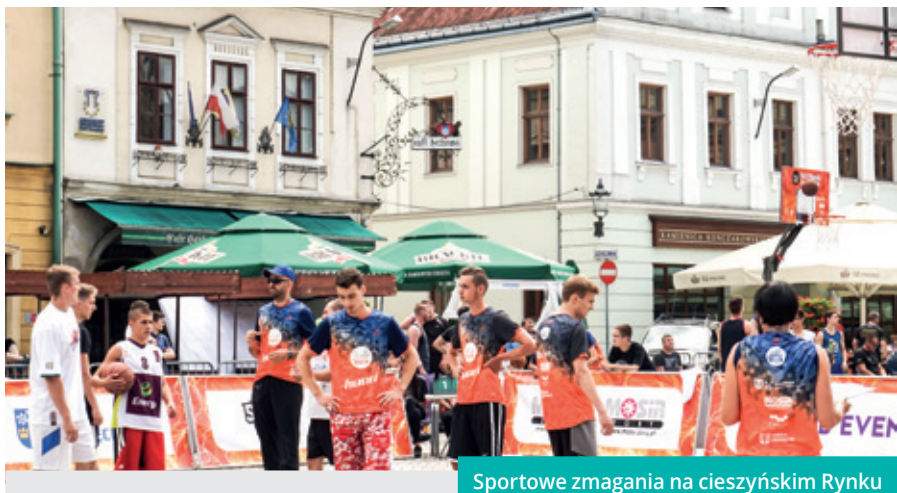
Sportowe zmagania na cieszyńskim Rynku

W rywalizacji najmłodszych adeptów koszykówki z klas 1-3 wystąpiły cztery zespoły. Bezkonkurencyjni okazali się „Niepokonani”. Oprócz nich na podium znalazły się także ekipy o niezwykle ciekawych nazwach „Różowe Lamy” oraz „3 legendy”. W rywalizacji drużyn z klas 4-6 Szkół Podstawowych wśród dziewcząt najlepsze okazały się następujące drużyny: „Giganci ze Stali”, „Lubiane Lemury” oraz „Wesołe Flamingi”. W tej samej kategorii wiekowej wśród chłopców zwyciężyli: „Yyy Mleko”, „Pomarańcze” oraz „Dobre Zielone”. W rywalizacji szkół gimnazjalnych najlepsi okazali się: „Airball Brothers”, na drugi miejscu uplasowali się „Stretriders” z kolei na najniższym stopniu podium stanęli „Splash Team”.