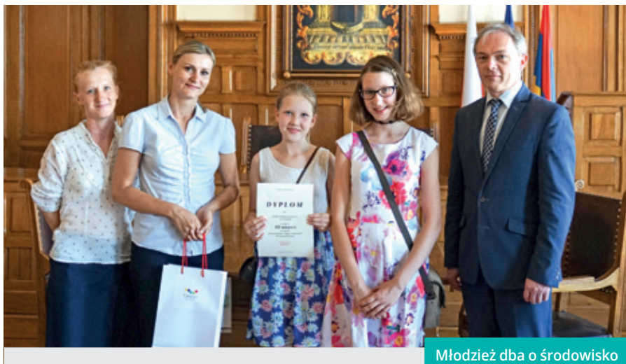
Młodzież dba o środowisko