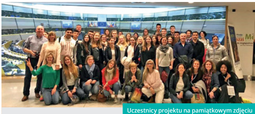
Uczestnicy projektu na pamiątkowym zdjęciu

W trakcie trwania projektu młodzież miała okazję pochwalić się swoimi produk-