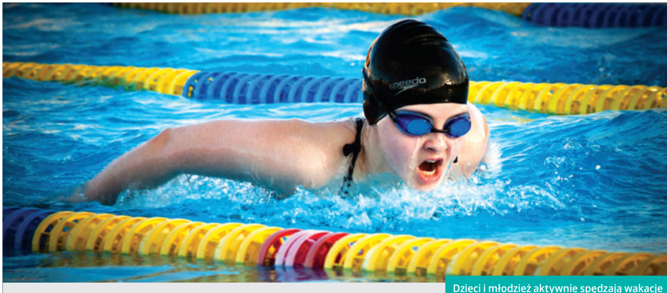
Dzieci i młodzież aktywnie spędzają wakacje