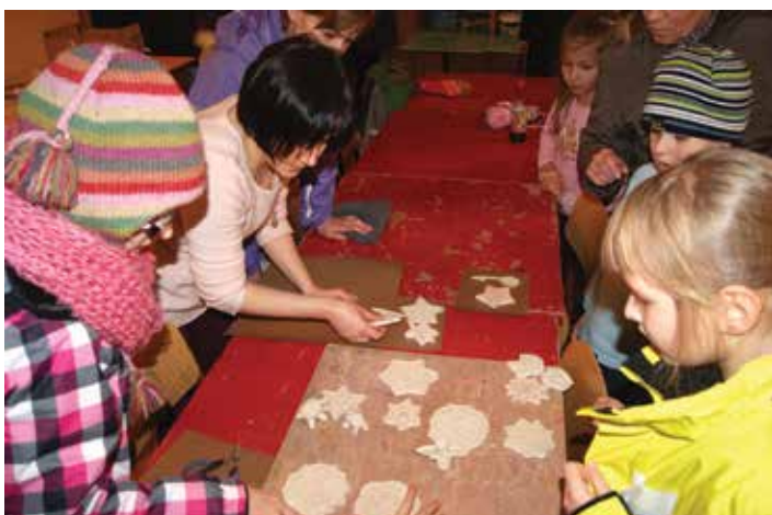
... oraz gliny. Swoje prace będzie można zabrać na pamiątkę do domu.