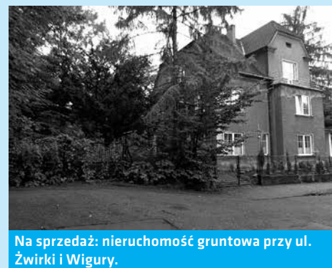
Na sprzedaż: nieruchomość gruntowa przy ul. Żwirki i Wigury.

Zgodnie z art. 43 ust. 1 pkt 9 ustawy z dnia 11 marca 2004 r. o podatku od towarów i usług