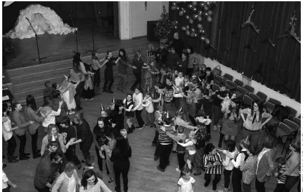
„Bal Aniołów” został zorganizowany przez Soroptimist International Klub w Cieszynie.

Po uroczystym otwarciu zebrani wysłuchali występu chóru z Zespołu Szkół Budowlanych w Cieszynie. W ramach integracji grup na początku imprezy uczniowie mieli możliwość obejrzenia kilku scenek teatralnych przygotowanych przez Kółko Wolontariatu działające również w tej szkole. Barwne stroje i znane postacie z bajek przyciągnęły