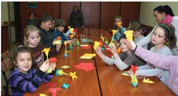
Na warsztatach dzieci wyczarują różne figury z papieru...