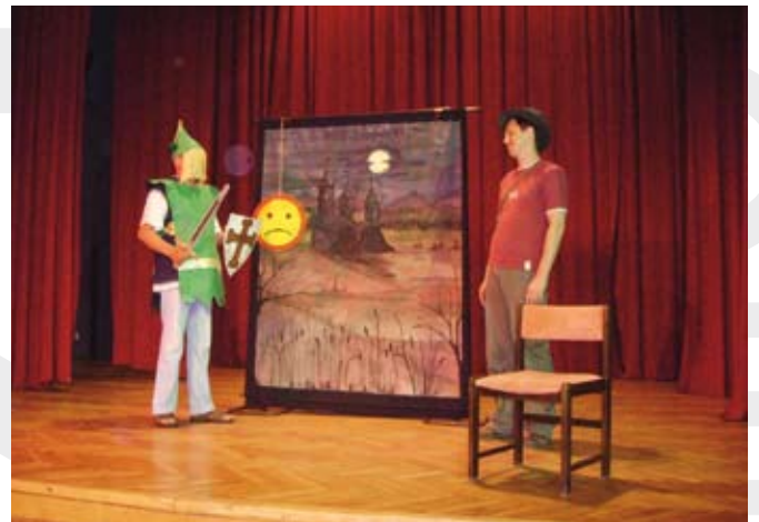
Bajka ze śmiechem