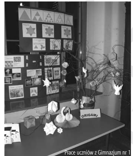
Prace uczniów z Gimnazjum nr 1

Jak wynika z przeprowadzonych w placówkach badań ankietowych, którymi objęto 2467 osób, projekt jest oceniany pozytywnie zarówno przez uczniów, jak i rodziców oraz prowadzących zajęcia nauczycieli. Respondenci ocenili go jako interesujący, potrzebny, sprzyjający rozwojowi zainteresowań, umożliwiający wyrównywanie braków w wiadomościach szkolnych. Uczniowie mogli rozwijać swoje indywidualne zdolności, dzięki czemu odnosili znaczące sukcesy w konkursach przedmiotowych. W ramach ogłoszonego przez Wydział Europejskiego Funduszu Społecznego Urzędu Marszałkowskiego Województwa Śląskiego