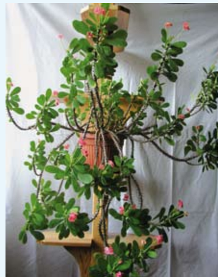
Kwitnący okaz z kolekcji Pana Piotra

Drewno niektórych kaktusów (starych cereusów) używane było do wyrobu sza-