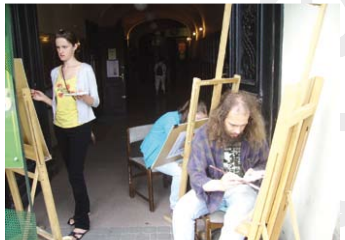
Plener malarski dla dorosłych