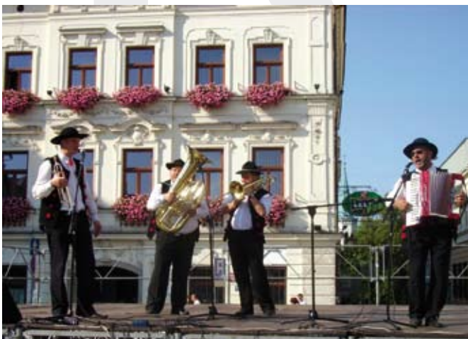
Występ kapeli Brynioki