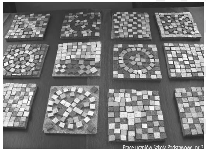
Prace uczniów Szkoły Podstawowej nr 3