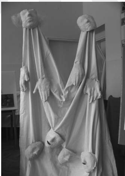
Praca uczniów Szkoły Podstawowej nr 3

Projekt współfinansowany przez Unię Europejską w ramach Europejskiego Funduszu Społecznego