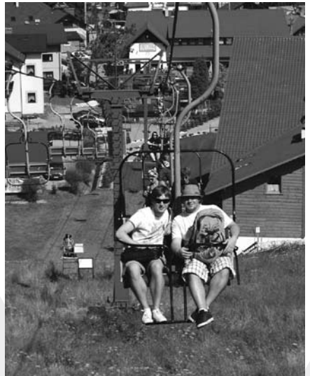
Wycieczka w Beskidy