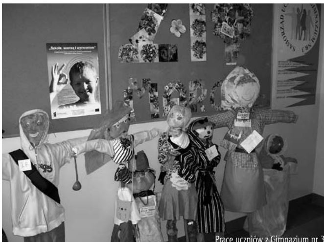
Prace uczniów z Gimnazjum nr 3