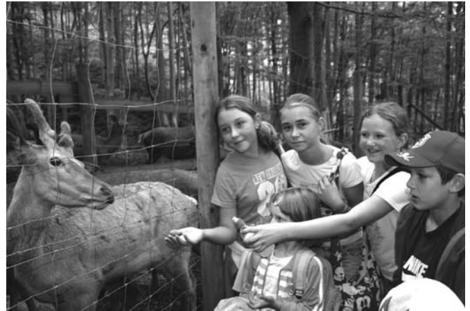
W Leśnym Parku Niespodzianek

Poza pracą twórczą był czas na poznawanie otaczającej nas malowniczej, górskiej okolicy poprzez piesze wędrówki po górach i spacer w Rajczy Sól oraz Ujsołach, zabawę podczas „Kicz party” oraz biesiadowanie przy płomieniach ogniska, któremu towarzyszył nasz śpiew przy dźwięku gitar i ciepły posiłek w postaci kiebasek i pieczonego chleba.