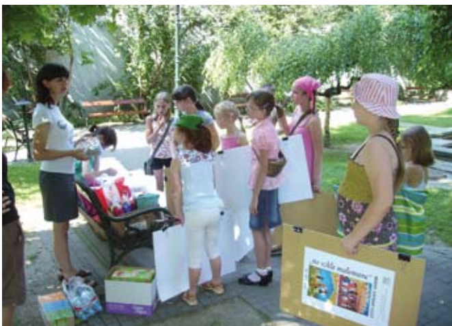
Plener malarski dla dzieci