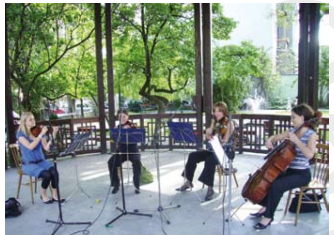
„Lato z muzyką” w Parku Pokoju