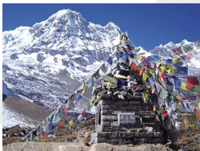
Zdjęcia z Indii i Nepalu