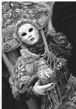
Jedną z prac prezentowanych na wystawie

Prace jej autorstwa prezentowane były w Galerii COK w listopadzie ubiegłego roku i ukazywały Chiny. Na obecnej wystawie znalazły się zdjęcia z Wenecji.