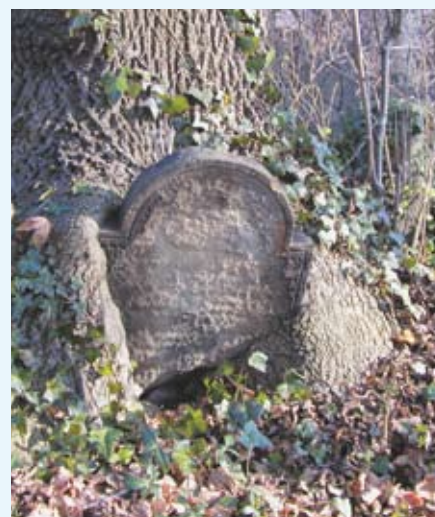
Macewa na starym cmentarzu żydowskim

(ciąg dalszy w następnych WR) Aleksander Dorda