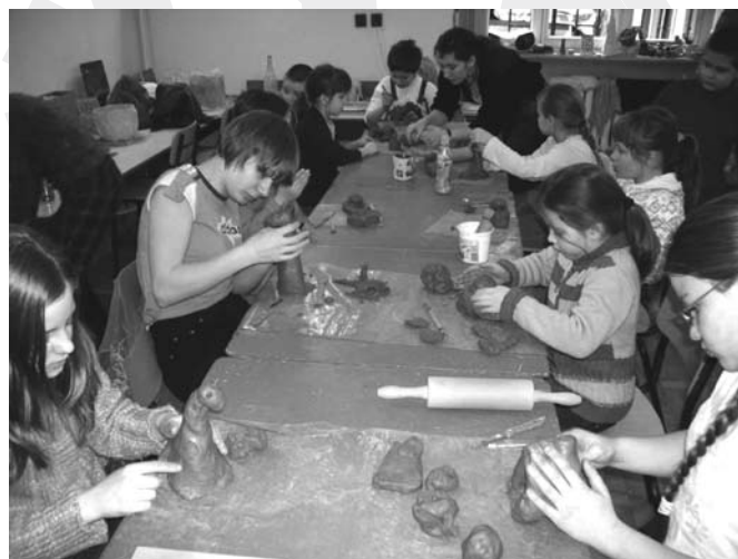
Ferie z ceramiką