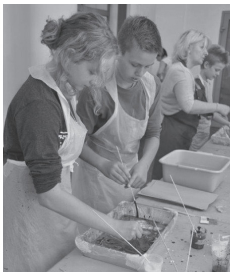
Kolejne warsztaty w Książnicy Cieszyńskiej.