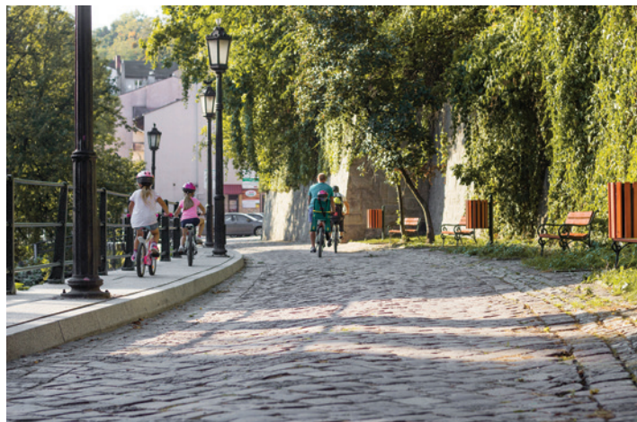
Odnowiona nawierzchnia w cieszyńskiej Wenecji.