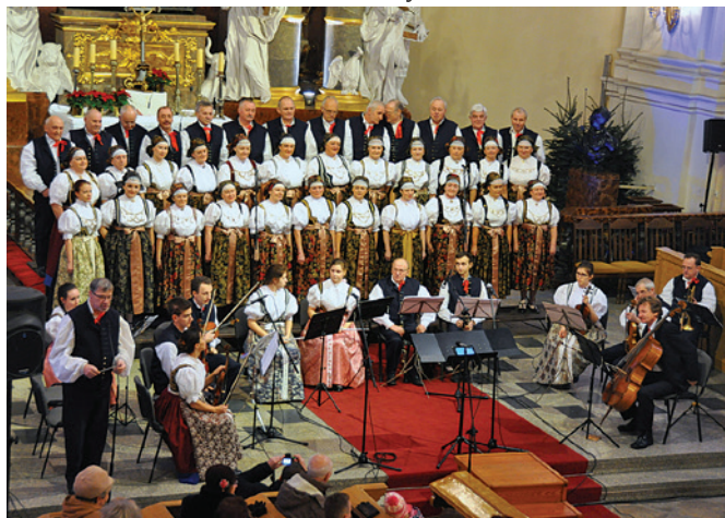
Chór Jubileuszowy ZPiT ZC podczas koncertu w kościele Jezusowym.

W tym miejscu chciałoby się szczerze rzec, a nawet głośno zawołać: Oby nie zabrakło tych, którzy w różnych formach wspierają i nadal chcą wspierać to piękne dzieło, które jest mozolnie budowane przez wiele pokoleń. „Zespolakiem” jest się na całe życie. Te słowa głęboko tkwią w nas wszystkich, którzy Zespołowi poświęcili i nadal poświęcają wiele czasu i serca, dlatego uczynimy wszystko co możliwe, aby ten kolorowy kwiat cieszyńskiej ziemi nadal mienił się barwami uśmiechu, z którego została stworzona nasza cała cieszyńska ziemia.