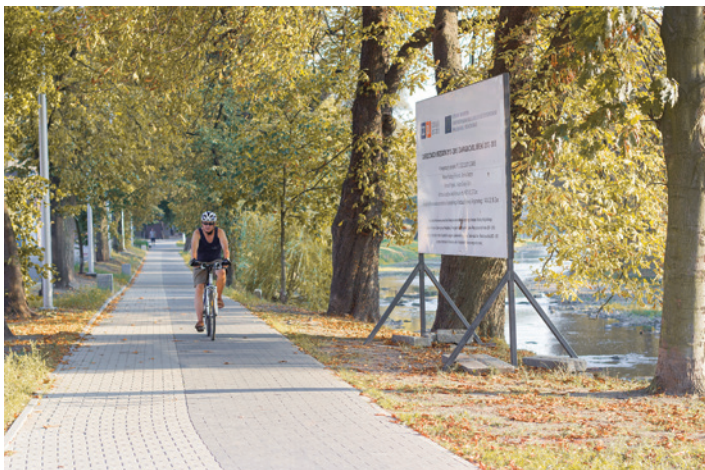
Przez „Ogród dwóch brzegów” prowadzą zarówno ścieżki piesze, jak i rowerowe.