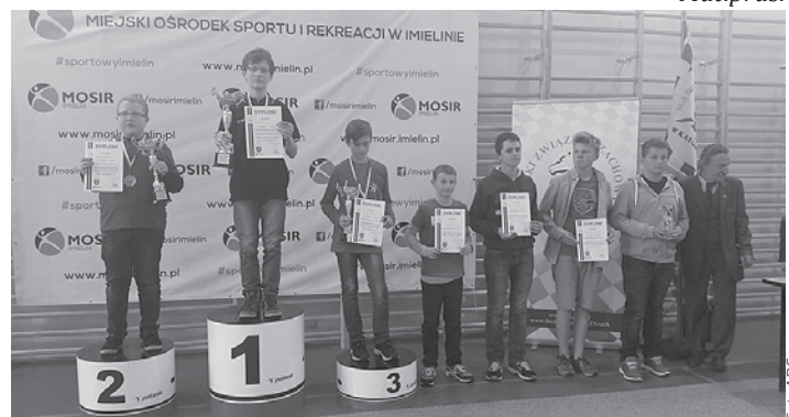
Ceremonia medalowa w kategorii chłopców do lat 15.