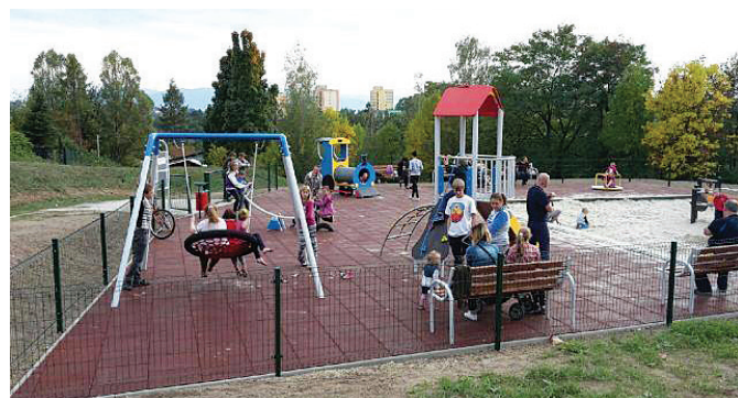
Mini Strefa Sportu i Rekreacji jeszcze nie została oficjalnie otwarta, a już cieszy się ogromną popularnością.

Karta do głosowania znajduje się na str. 9-12.