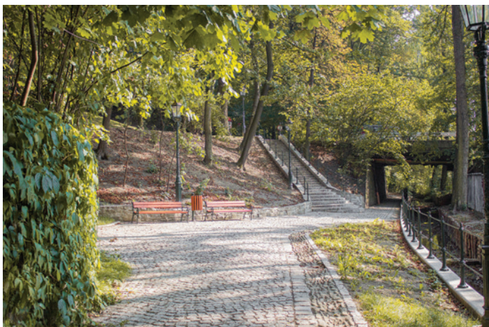
Cieszyńska Wenecja w jesiennych barwach prezentuje się bardzo okazale,