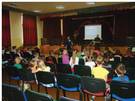
Dzieci uczyły się, jak bezpiecznie poruszać się po drogach.

23 września naszą szkołę odwiedzili funkcjonariusze policji i Straży Miejskiej, którzy spotkali się z uczniami klas pierwszych. Podczas spotkania dzieci mogły dowiedzieć się, w jaki sposób mają zachowywać się w drodze do i ze szkoły, żeby była dla wszystkich bezpieczna. Na koniec spotkania wszyscy pierwszoklasiści otrzymali w prezencie odbłaski, dzięki którym będą zawsze widoczni na drodze. Mamy nadzieję, że o zasadach bezpiecznego poruszania się będą pamiętać nie tylko nasi najmłodszy uczniowie, ale także dorośli, odpowiedzialni za bezpieczne przeprowadzanie dzieci do szkoły, jak i ich równie bezpieczny powrót do domu.