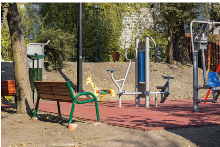
W ramach projektu zamontowano również urządzenia do ćwiczeń, z których mogą skorzystać mieszkańcy i turyści.