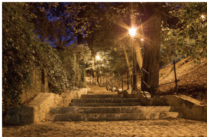
Podczas wieczornych spacerów można podziwiać odnowione trakty.

Projekt współfinansowany przez Unię Europejską z Europejskiego Funduszu Rozwoju Regionalnego w ramach Programu Operacyjnego Współpracy Transgranicznej Republika Czeska – Rzeczpospolita Polska 2007-2013 http://www.cz-pl.eu