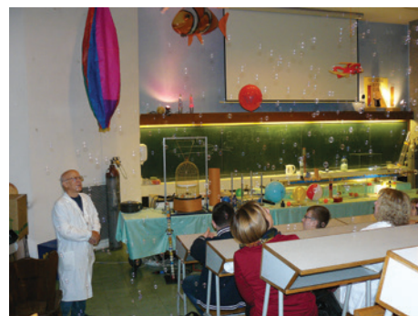
Dzieci z zacięciem oglądały latające bańki.