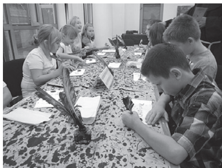
Warsztaty czerpania papieru w Szkole Podstawowej nr 4.

– W bieżącym roku szkolnym szkoła prowadzi w ramach zajęć pozalekcyjnych 51 kół przedmiotowych, fakultetów i zajęć uzupełniających z przedmiotów, na które uczęszcza łącznie 602 uczniów. Ponadto w szkole działają dwa koła artystyczne i chór szkolny, na które regularnie uczęszcza 56 uczniów. Szkoła prowadzi również pozalekcyjne zajęcia sportowe w trzech grupach, z których korzysta 65 uczniów – poinformował Janusz Łukomski-Prajzner, dyrektor I LO im. A. Osuchowskiego w Cieszynie.