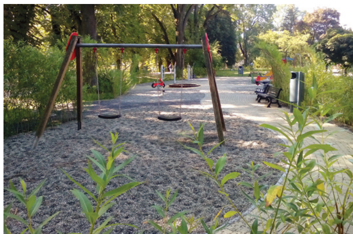
Także dzieci znajdują coś dla siebie...