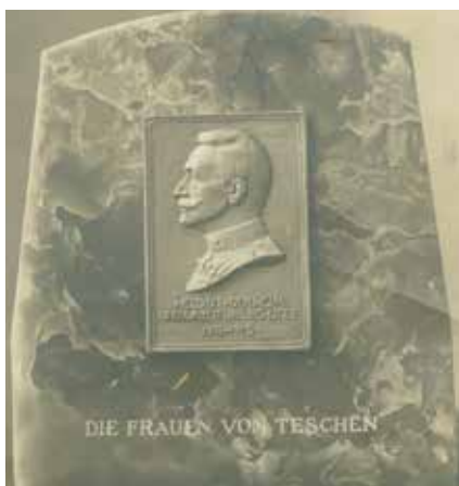
➤ Pamiątkowa plakietka

Studiując listę organizacji i stowarzyszeń, działających w Cieszynie przed wybuchem I wojny światowej, można popaść w zachwyt nad ich liczbą, jako że księga adresowa rejestruje w roku 1914 aż 179 stowarzyszeń! Co więcej, znajdziemy pośród nich kilkanaście organizacji skupiających cieszyńskie kobiety!