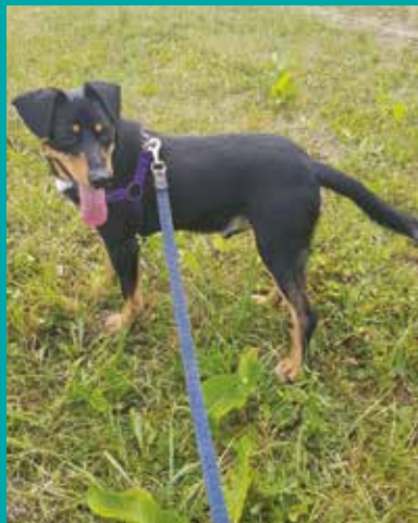
FUNDACJA „LEPSZY ŚWIAT”

W cieszyńskim schronisku „Azy!” psiaki czekają na nowy dom. Przytuł psisko i zyskaj czworonożnego członka rodziny! Kontakt w sprawie adopcji: 33 851 55 11, Fundacja „Lepszy Świat” - 793 555 194, 782 717 771.