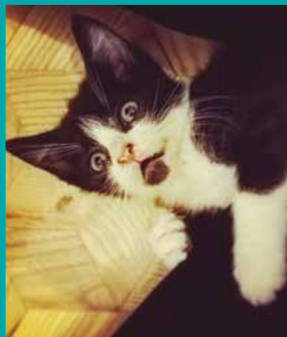
FUNDACJA „LEPSZY ŚWIAT”

Kredka to energiczna koteczka, której obserwacja podczas zabawy może przyprawić o ból brzucha (ze śmiechem). Poza tym uwielbia wygrzewać się na słońcu i gonić za pluszową myszką razem ze swoim bratem – Pędzelkiem. To przeurocza i bardzo odważna koteczka, która łączy do ludzi. Z pewnością będzie jednym z tych kotów, który z przyjemnością będzie mrucał swojemu człowiekowi kołyśanki „na dobranoc”.