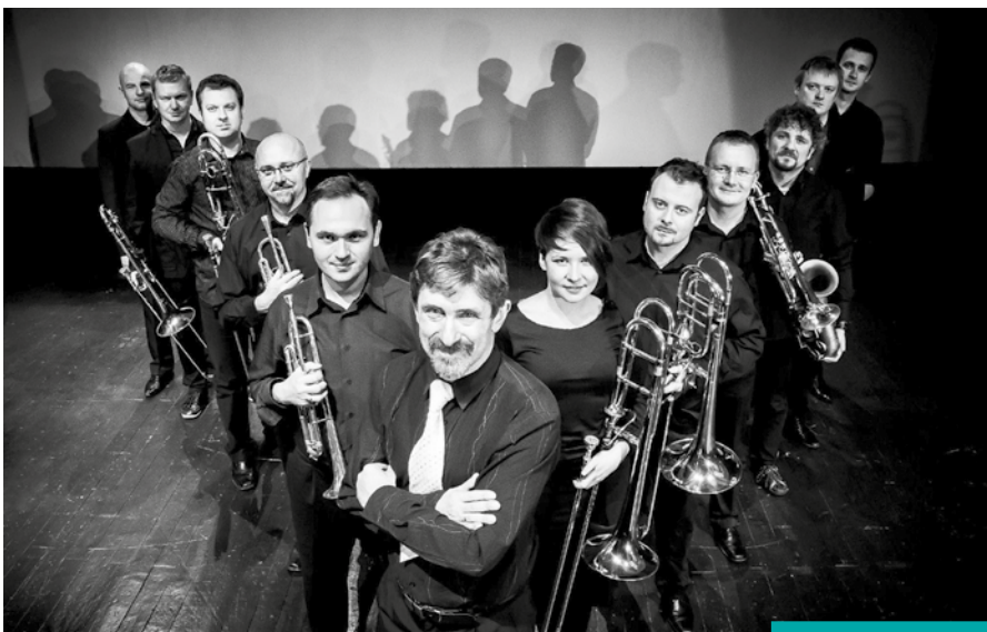
Big Silesian Band