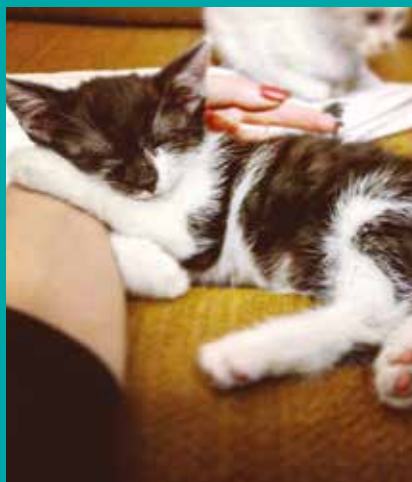
FUNDACJA „LEPSZY ŚWIAT”

W Kocim Zakątku znajduje się dużo kotów, które czekają na miłość człowieka, nowy, kochający dom. Kontakt w sprawie adopcji: Fundacja „Lepszy Świat”, tel. 664988487. Obowiązuje wizyta przedadopcjna.