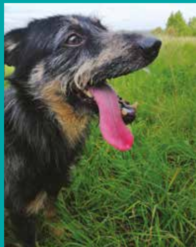
FUNDACJA „LEPSZY ŚWIAT”

Robi to bardzo wesoły psiak, którego rozpiesza energia – chce biegać, bawić się, być blisko człowieka. Jest pozytywnie nastawiony do ludzi, na spacerach zachowuje się grzecznie, na inne psy reaguje spokojnie, nie szuka zaczepki. Nie jest jeszcze mistrzem w chodzeniu na smyczy, ale jest to zachowanie możliwe do skorygowania. Uwielbia smakołyki, bardzo chciałby je dostawać od zaprzyjaźnionego człowieka w swoim nowym domu. Robi ma około 3 lat, jego numer ewidencyjny w cieszyńskim schronisku: 116/2019.