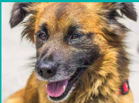
FUNDACJA „LEPSZY ŚWIAT”

Pod opieką Fundacji „Lepszy Świat” znajduje się dużo psów i kotów, które czekają na nowy, kochający dom.