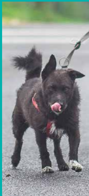
FUNDACJA „LEPSZY ŚWIAT”