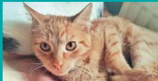
FUNDACJA „LEPSZY ŚWIAT”