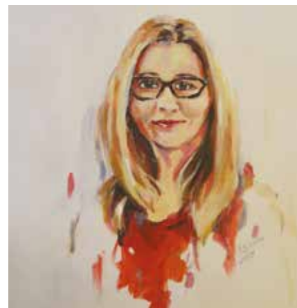
SEKCJA PROMOCJI ZDROWIA

Prace artystki można było niejednokrotnie podziwiać na wystawach indywidualnych oraz zbiorowych ustońskiego Stowarzyszenia Twórczego „Brzimy”, do którego należy od wielu lat. Pracuje zawodowo, jednakże każdą wolną chwilę spędza w pracowni, oddając się swojej pasji. Głównymi motywami jej prac obok