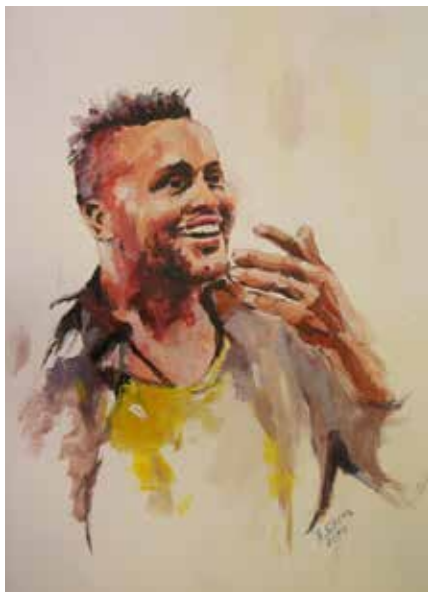
SEKCJA PROMOCJI ZDROWIA

W listopadowej odsłonie Galerii Zmiennej można oglądać „Portrety” – wystawę prac Beaty Sikory-Małyjurek. Artystka prezentuje twarze osób, na których pojawiają się ulotne emocje, odzwierciedlające chwilowy stan ducha - zamyślenie, radość, skupienie, jakie pojawiają się na krótką lub dłuższą chwilę. Wystawa potrwa do 1 grudnia. Wstęp bezpłatny.