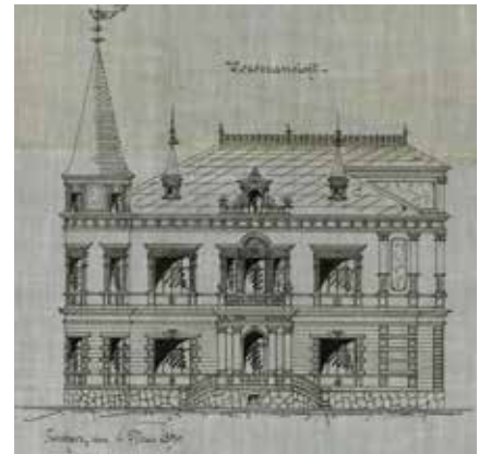
O CIESZYN