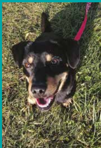
FUNDACJA „LEPSZY ŚWIAT”

Pod opieką Fundacji „Lepszy Świat” znajduje się dużo psów i kotów, które czekają na miłość człowieka i nowy, kochający dom.