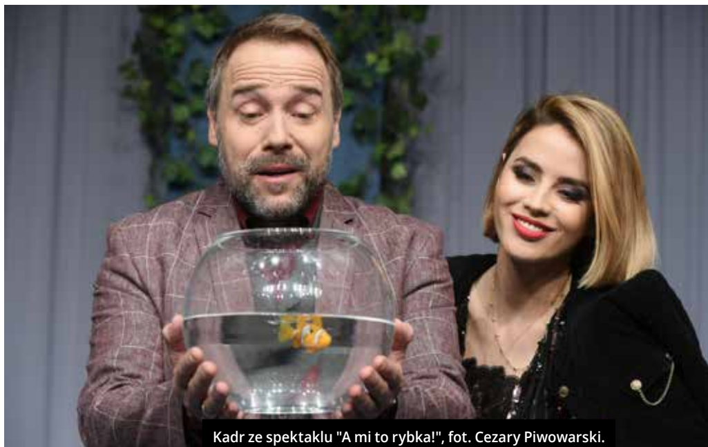
Kadr ze spektaklu "A mi to rybka!", fot. Cezary Piwowarski.

Zelt, Marcin Troński/Tomasz Gęsikowski, Piotr Miazda/Rafał Szałajko