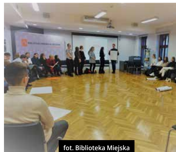
fol. Biblioteka Miejska