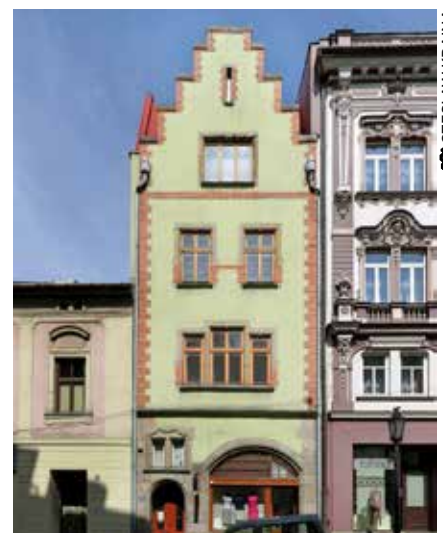
^ Kamienica przy ul. Głębokiej 46