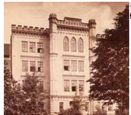
^ Dawne gimnazjum ewangelickie, 1883 r.