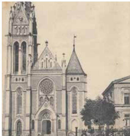
^ Kościół pojezuicki, 1907 r.