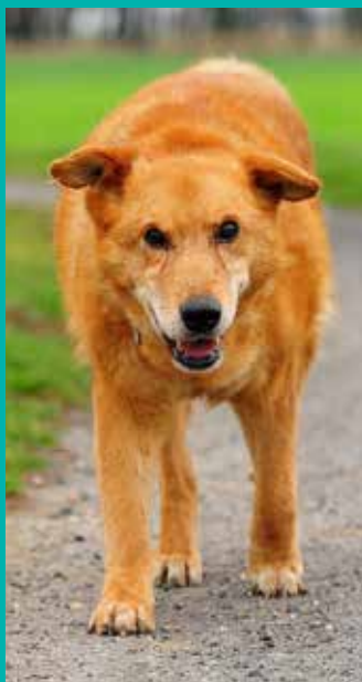
FUNDACJA „LEPSZY ŚWIAT”

Pod opieką Fundacji „Lepszy Świat” znajduje się dużo psów i kotów, które czekają na nowy, kochający dom.