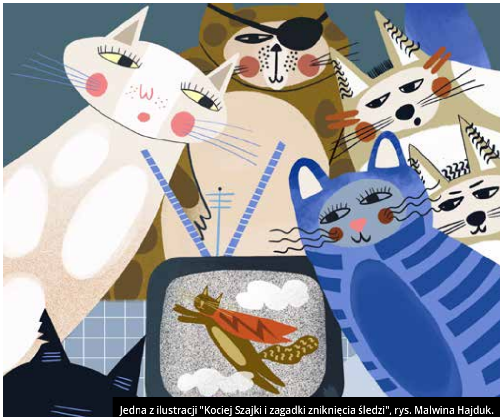
Jedna z ilustracji "Kociej Szajki i zagadki zniknięcia śledzi", rys. Malwina Hajduk.

"Chcę, by książka, choć skierowana do dzieci, służyła wszystkim – by rozwijała miasto turystycznie, zachęcała do rozmów, uśmiechu, inspirowała do częstych wizyt."