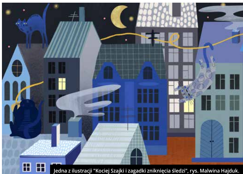
Jedna z ilustracji "Kociej Szajki i zagadki zniknięcia śledzi", rys. Malwina Hajduk.

– Złoczyńca jest postacią fikcyjną, podobnie jak nie istnieje jego sklep.