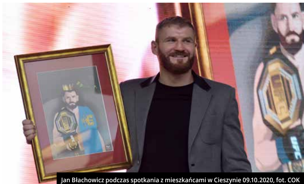
Jan Błachowicz podczas spotkania z mieszkańcami w Cieszynie 09.10.2020

Czy to zwycięstwo sprawi, że eksperci przyznają się do tego, że dotąd nie doceniali Cieszyńskiego Księcia i jego siły? Wszystko wskazuje na to, że tak. W takim tonie wypowiedział się np. Daniel Cormier, legenda świata UFC: – Czy Adesanya jest w stanie wygrywać z zawodnikami z kategorii półciężkiej? Oczywiście. Tego wieczoru po prostu nie mógł pokonać Błachowicza. Jan nie bez powodu jest mistrzem. Jest naprawdę dobry, silny, ma fantastyczne cardio i podbródek. Do tego jest pewny siebie, co uzupełnia wszystkie