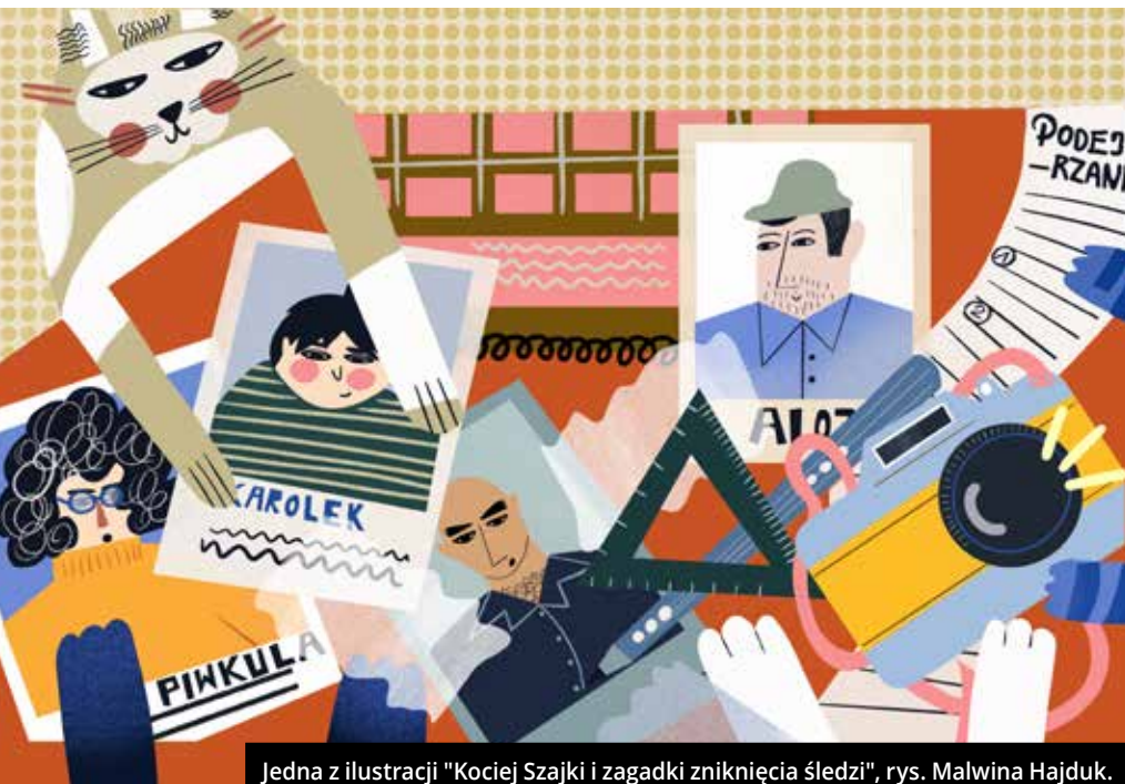
Jedna z ilustracji "Kociej Szajki i zagadki zniknięcia śledzi", rys. Malwina Hajduk.

we włosach kokardą. Dzisiaj staram się pokazać tę wyjątkowość moim synom. Chciałabym, żeby mogli zobaczyć to, co mnie tak bardzo tu zachwyca.