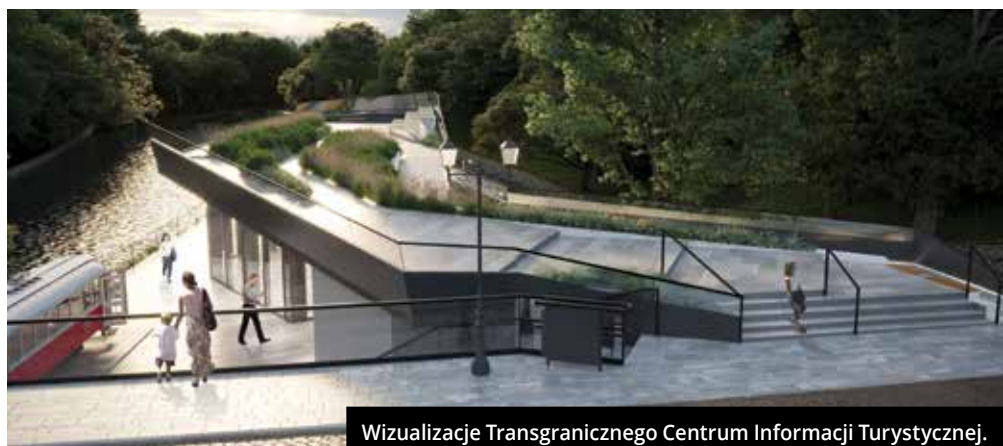
Wizualizacje Transgranicznego Centrum Informacji Turystycznej.

• • • Oddajemy w Państwa ręce Wiadomości Ratuszowe w nowej szacie graficznej. Staramy się iść z duchem czasu, podawać informacje w sposób czytelny, przejrzysty i miły dla oka. Mamy nadzieję, że zaproponowane zmiany przyjmiecie równie entuzjastycznie, jak zespół przygotowujący dla Państwa nasz dwutygodnik. Miłej lektury! ♦