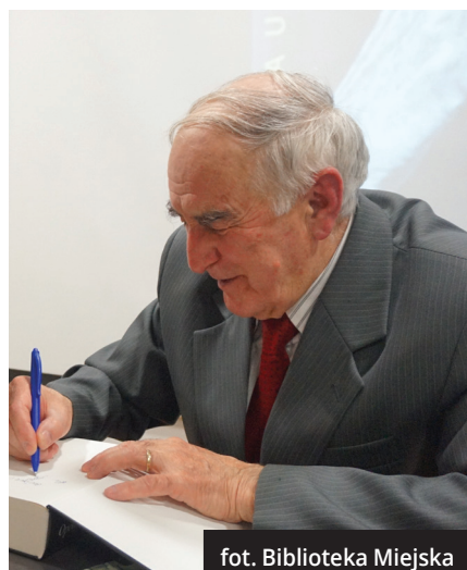
fol. Biblioteka Miejska