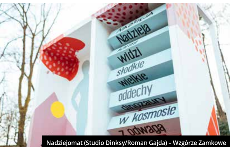
Nadziejomat (Studio Dinksy/Roman Gajda) – Wzgórze Zamkowe

W poprzednim numerze informowaliśmy, że z okazji swoich 16. urodzin Zamek Cieszyn poprosił grupę twórców, by w tych trudnych czasach "wkroczyli" oni w przestrzeń Cieszyna i podarowali nam dawkę nadziei, odwagi i radości... Wybraliście się już na spacer szlakiem symbolicznych przystanków z nadzieją w tle? Jeśli nie, to ruszajcie w drogę ulicami miasta! Informacje oraz mapa na www.zamekcieszyn.pl .