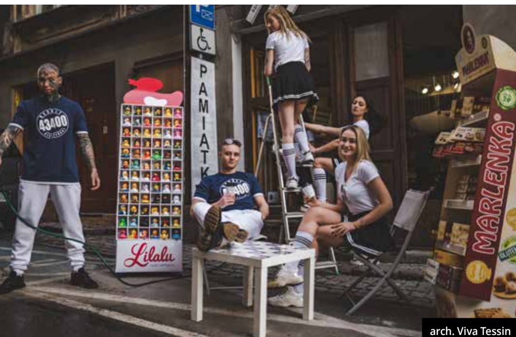
arch. Viva Tessin