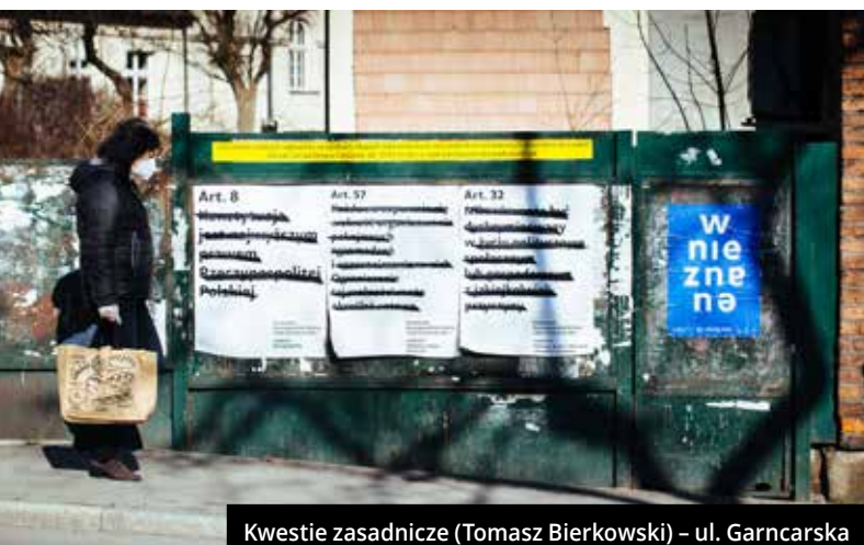
Kwestie zasadnicze (Tomasz Bierkowski) – ul. Garncarska