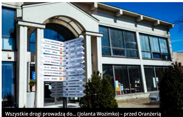
Wszystkie drogi prowadzą do... (Jolanta Wozimko) – przed Oranżerią