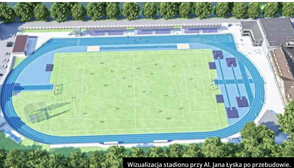
Wizualizacja stadionu przy Al. Jana Łyska po przebudowie.

Chciałabym w tym miejscu jeszcze raz podziękować radnym, trenerom, działaczom sportowym, rodzicom, a także pracownikom Urzędu Miejskiego, którzy zaangażowani byli w wielomiesięczne prace nad tym programem. Stawiamy sobie ambitne cele, mając świadomość, jak ważnym elementem życia społecznego i rodzinnego jest sport i rekreacja. Zachęcam do zapoznania się z pełną treścią Programu, która dostępna jest w Biuletynie Informacji Publicznej Miasta Cieszyna i na stronie www.sport.cieszyn.pl .