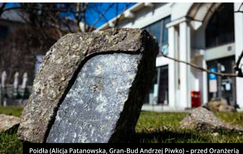
Poidła (Alicja Patanowska, Gran-Bud Andrzej Piwko) – przed Oranżerią