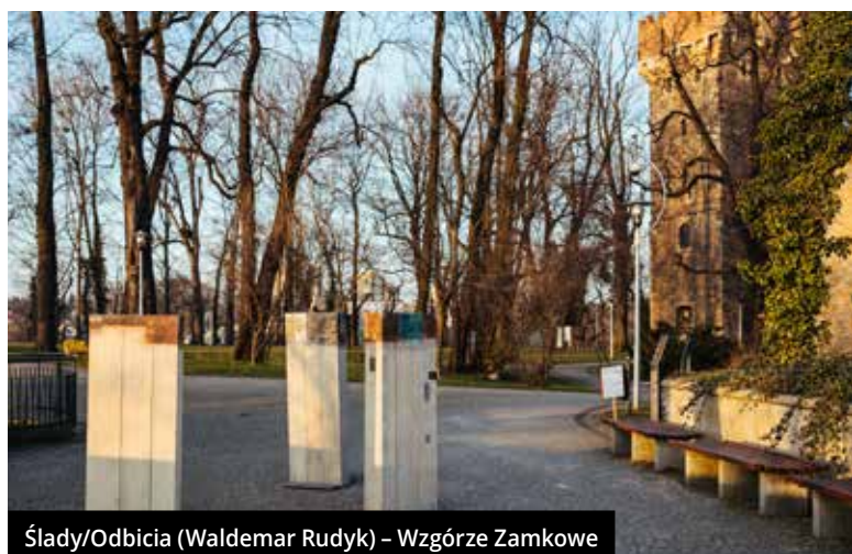
Ślady/Odbicia (Waldemar Rudyk) – Wzgórze Zamkowe