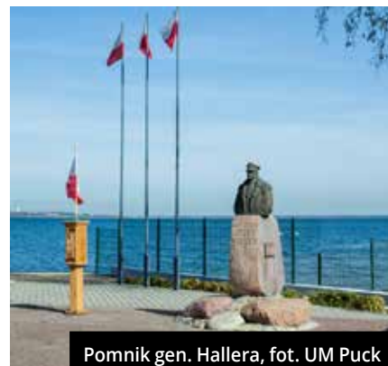
Pomnik gen. Hallera