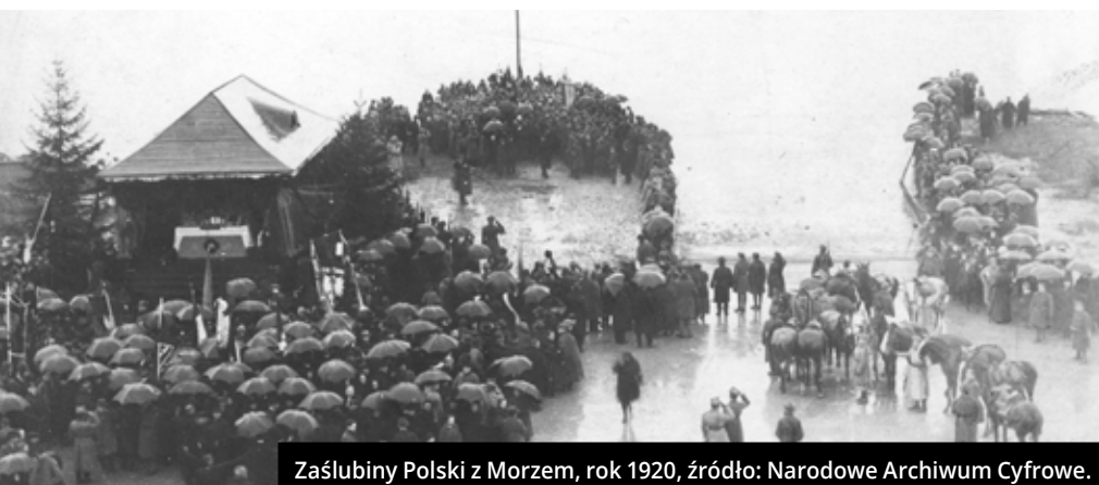
Zaślubiny Polski z Morzem, rok 1920, źródło: Narodowe Archiwum Cyfrowe.

Na mocy kończącego I wojnę światową traktatu wersalskiego ratyfikowanego 10 stycznia 1920 r. Polska mogła objąć we władanie znaczną część ziem zabranych jej przez Prusy w I i II rozbiórce, w tym niewielki pas wybrzeża morskiego. Nasza nowa granica morska przebiegała od ujścia rzeki Piaśnicy w miejscowości Dębki do Gdyni Kolibek i wraz z linią brzegową Półwyspu Helskiego liczyła łącznie 147 km.