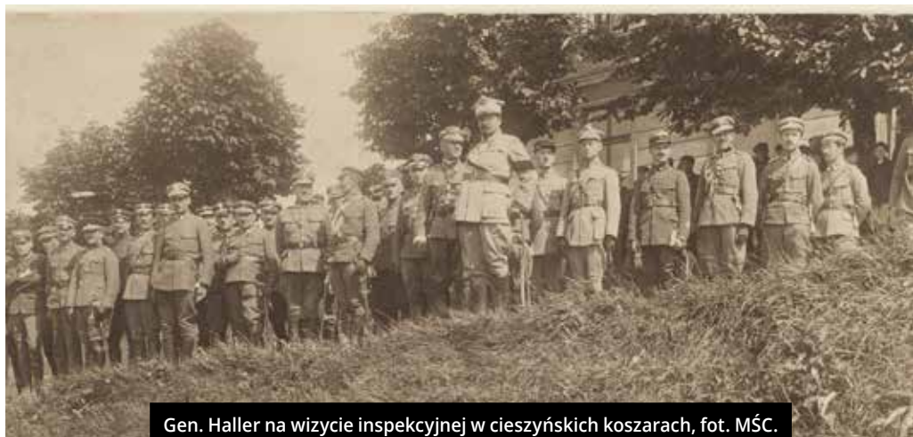
Gen. Haller na wizycie inspekcyjnej w cieszyńskich koszarach, fot. MŚC.

IRENA FRENCH MUZEUM ŚLĄSKA CIESZYŃSKIEGO