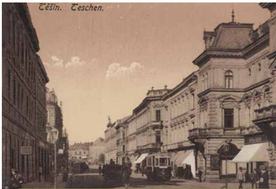
Sachsenberg, 1921. Księgarnia D. Hutterera – pod markizą po prawej stronie zdjęcia.

Bitwa pod Gorlicami, zwana czasami „małym Verdun”, przez wielu uważana jest za najważniejszą bitwę Wielkiej Wojny na froncie wschodnim. Ofensywa pierwszych dni maja 1915 roku doprowadziła do przełamania frontu rosyjskiego i stała się wyraźnym punktem zwrotnym. Pod Gorlicami walczyło kilkanaście narodowości. Polacy walczyli po obu stronach: i w wojsku rosyjskim, i w niemieckim oraz austro-węgierskim. Szacuje się, że operacja ta pochłonęła ok. 200 tysięcy ofiar. Ich ciała spoczęły potem w sąsiedztwie pól bitewnych na kilkudziesięciu cmentarzach, nad zakładaniem których czuwał Wydział Grobów Wojennych, utworzony