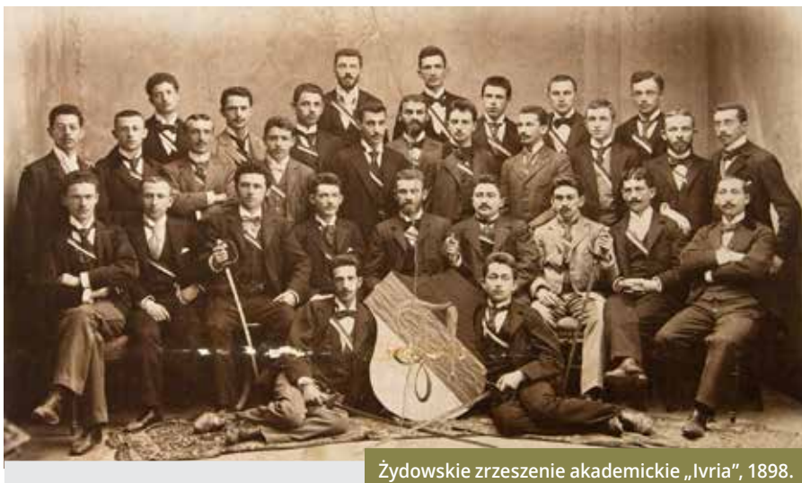
Żydowskie zrzeszenie akademickie „Lvria”, 1898.