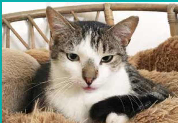
FUNDACJA „LEPSZY ŚWIAT”

Pod opieką Fundacji „Lepszy Świat” znajduje się dużo psów i kotów, które czekają na nowy, kochający dom.