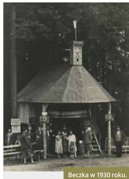
Beczka w 1930 roku.

gatywnego) rozgłosu. Przypisywana jej szpetota była przyczyną protestu Zarządu Głównego Polskiego Towarzystwa Tatrzańskiego, który ze wstrętem sprawozdawał: „Spragniony naród wszelkiego autoramentu zyskał więc na Kubalonce źródło podwójnych wzruszeń: możliwość ugaszenia pragnienia szlachetnym zimnym płynem i pokrzepienia na duszy piękną architekturą piwną”. Protest doprowadził ostatecznie do interwencji u wojewody śląskiego, Michała Grażyńskiego, w wyniku której już w roku 1931 beczka została obudowana stylowym domkiem (i tak przetrwała do dziś!) i PTT triumfalnie ogłosiło, że „najśmielszy wyczyn architektury w Beskidach Zachodnich nie istnieje!” ♦