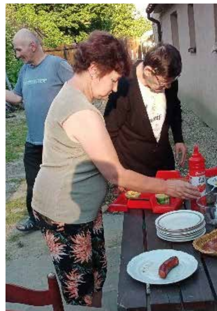
CENTRUM EDUKACJI SOCJALNEJ

Stowarzyszenie „Być Razem” od ponad dwudziestu lat swojej pracy niesie pomoc osobom bezdomnym, uzależnionym, ofiarom przemocy, dzieciom i młodzieży oraz