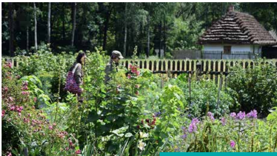
Ogród wiejski – skansen Kolbuszowa