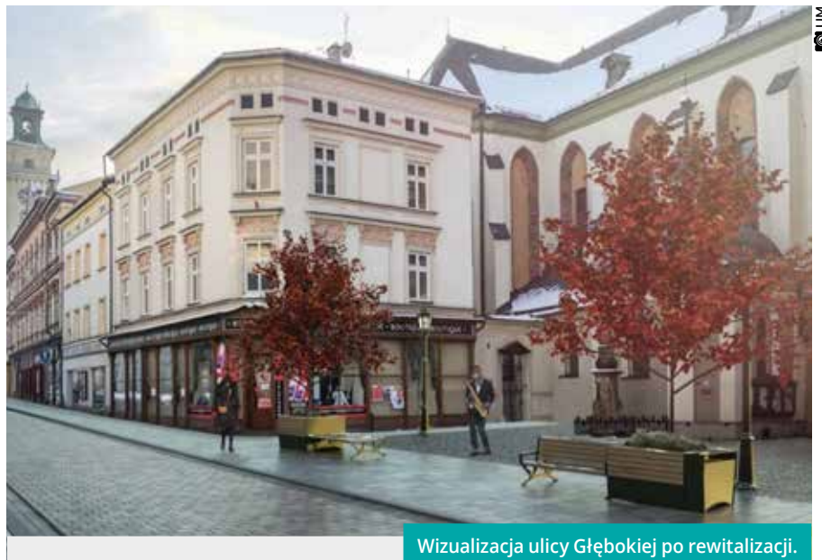
Wizualizacja ulicy Głębokiej po rewitalizacji.

- Tego „tramwaju” nie może zatrzymać nawet pandemia! – wspólnym głosem dodają burmistrzowie Cieszyna po obu stronach Olzy w odpowiedzi na uzasadnione pytania o losy budżetu miejskiego w czasach zbliżającego się kryzysu. – Kryzys nie dotknął nas, tylko cały świat. Natomiast tylko my w Cieszynie mamy teraz szansę, aby za kilka lat dysponować produktem promocyjnym z prawdziwego zdarzenia. W końcu pandemia będzie zwalniać, a nasze miasto może nieoczekiwanie przyspieszyć z rozwojem turystyki – prognozuje Staszkiwicz.