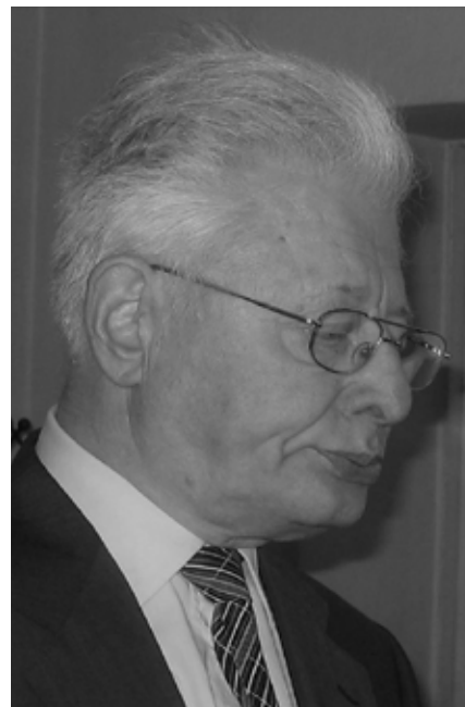
PARAFIA EWANGELICKA W CIESZYŃNIE