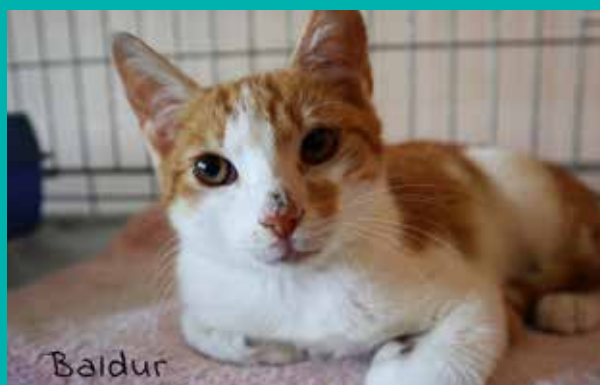
FUNDACJA „LEPSZY ŚWIAT”

Pod opieką Fundacji „Lepszy Świat” znajduje się dużo psów i kotów, które czekają na nowy, kochający dom.