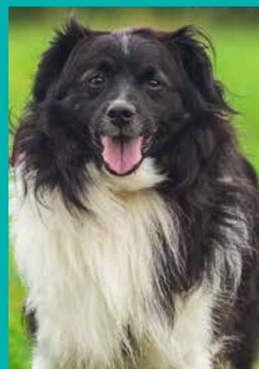
FUNDACJA „LEPSZY ŚWIAT”

CIAPUŚ jest długowłosem, małym, czarno-białym kundelkiem, o długiej miękkiej sierści. W kłębie liczy około 40 cm. Do cieszyńskiego schroniska trafił we wrześniu 2019 roku. Ma około 6 lat. W trakcie spaceru z wolontariuszką Fundacji „Lepszy Świat” początkowo wykazywał zachowania lękowe – obawiał się zakładania smyczy i kontaktu z człowiekiem. Ale pozwolił wziąć się na ręce i w ten sposób „rozpoczął” pierwszy, wspólny spacer. Gdy już przełamał lęki i zaczął coraz odważniej spacerować, okazał się bardzo spokojnym psem, który bezproblemowo chodzi na smyczy, słucha przewodnika, nie wrywa się. Raczej unika kontaktu z innymi psami i ma ograniczone zaufanie do ludzi. Jednak w wolontariuszką nawiązał kontakt – pozwalał się pogłaskać. Kolejne spacerki pokazały, że w towarzystwie osób i zwierząt, przy których czuje się bezpiecznie, nabiera większej pewności. Bez wątpienia w Ciapku tkwi dużo potencjału na dobrego przyjaciela. Jego numer