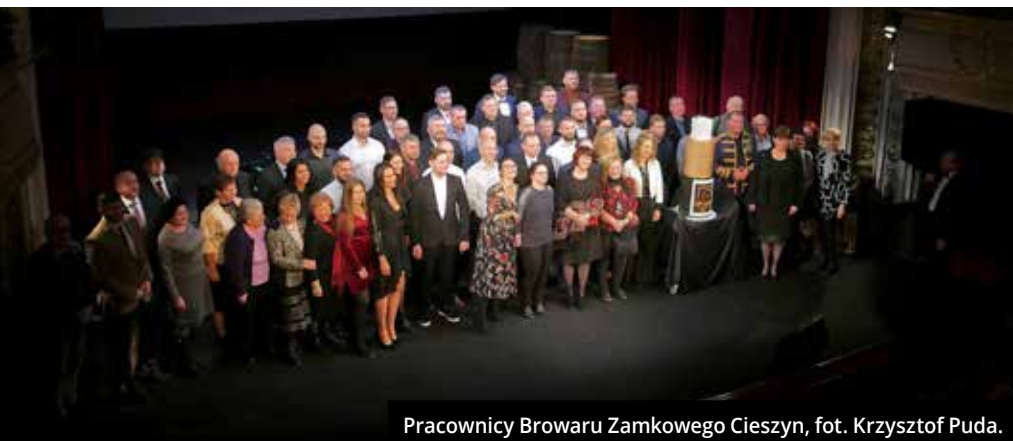
Pracownicy Browaru Zamkowego Cieszyn, fot. Krzysztof Puda.

10 grudnia w Teatrze im. A. Mickiewicza odbyła się gala jubileuszowa 175-lecia Browaru Zamkowego Cieszyn. W uroczystości wzięli udział zaproszeni goście, a także obecni i byli pracownicy browaru. Nie zabrakło wspomnień, historii, podsumowań tego, co było, opowieści o tym, co jest i deklaracji tego, jakie są plany jubilata na przyszłość.