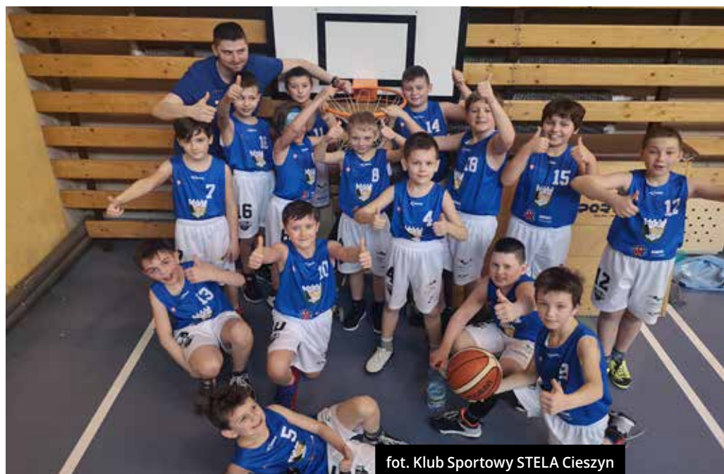
fort. Klub Sportowy STELA Cieszyn