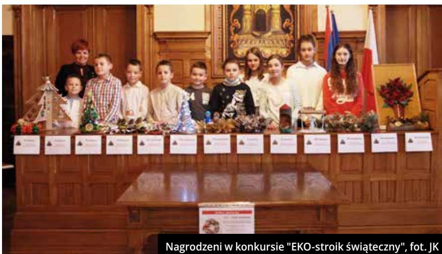
Nagrodzeni w konkursie "EKO-stroik świąteczny"