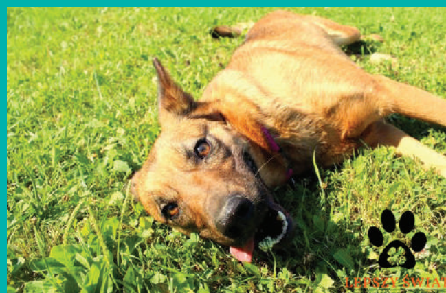
FUNDACJA „LEPSZY ŚWIAT”

Pod opieką Fundacji „Lepszy Świat” znajduje się dużo psów i kotów, które czekają na miłość człowieka i nowy, kochający dom. Adoptuj zwierzaka i zyskaj przyjaciela na całe życie!