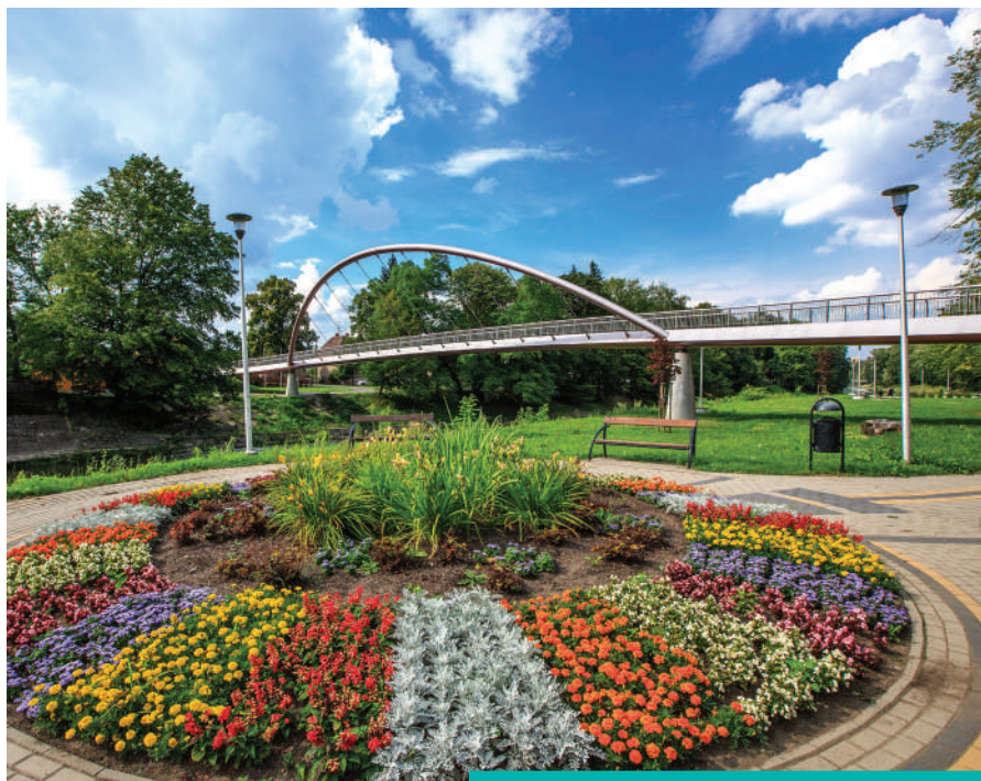
Kompleks rekreacyjno-sportowy wzdłuż Olzy.