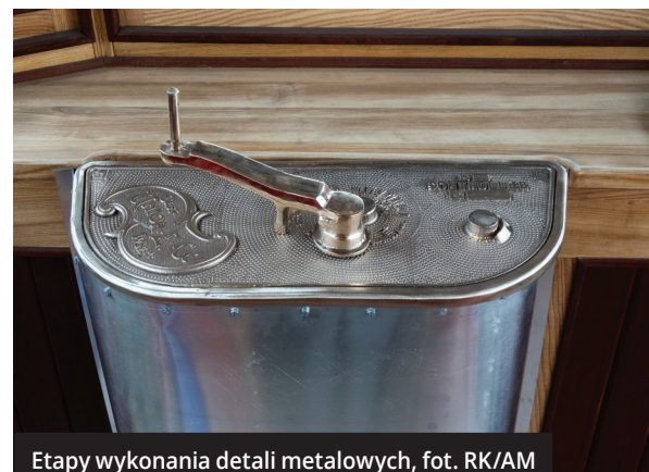
Etapy wykonania detali metalowych, fol. RK/AM